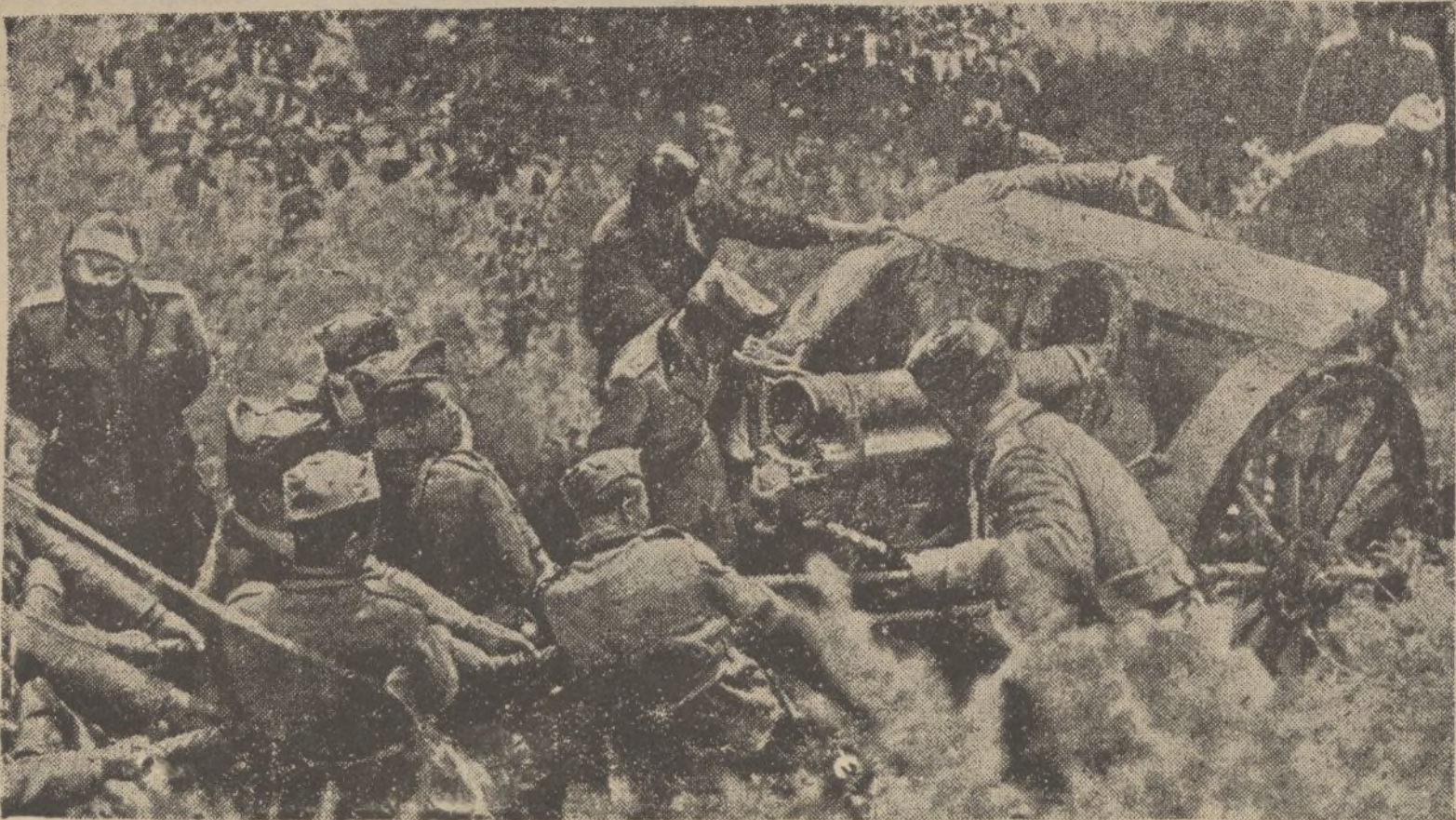
Italia continúa haciendo prácticas guerreras ante una posible contienda con Abisinia. Un Cuerpo de ejército integrado por medio millón de hombres ha realizado un táctico en las montañas del Tirol. Los soldados arrastran un cañón de gran calibre entre los macizos de la cordillera.

De venta en la Papelería del DIARIO DE HUELVA