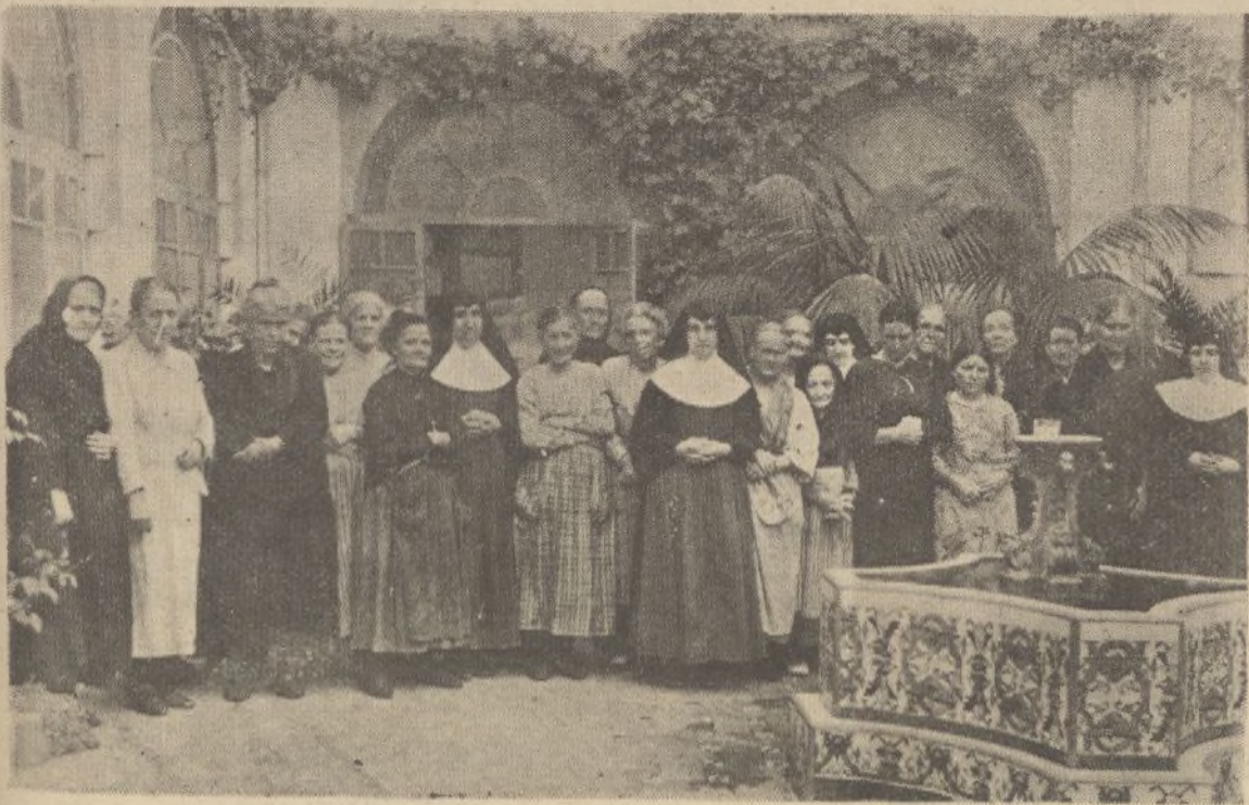
Grupo de ancianas acogidas en el Asilo de Ancianos Desamparados.

durante el día y raudales de aire puro a todas las horas.