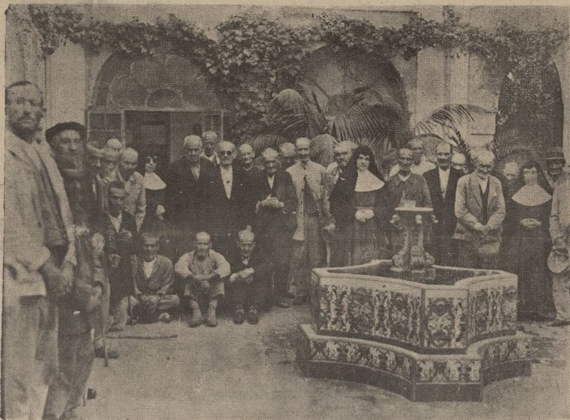
Los ancianitos que en el Asilo de Ancianos viven de la caridad de los onubenses y cuidados por las Hermanitas.

Extremamos nuestra curiosidad y quisimos saber como las Hermanitas, excelentes administradoras que tanto saben de la multiplicación de los panes y de los peces, se las componían para el sostenimiento de la casa, cuyo coste tiene forzosamente que suponer un «pico»