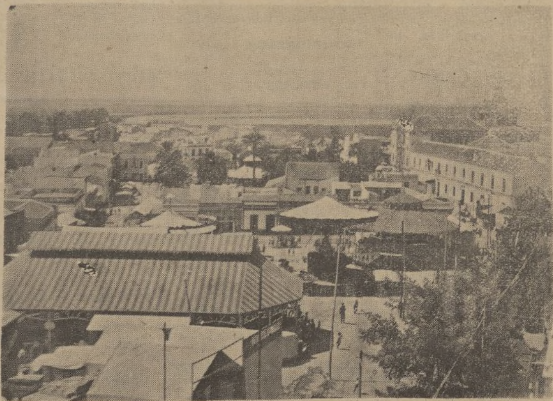
Una vista del paseo de Buenos Aires, o Cuesta de Carnicero, donde se desarrolla la feria, juguetona y bulliciosa, al socaire de las barracas, columpios y puestos de «tios vivos».