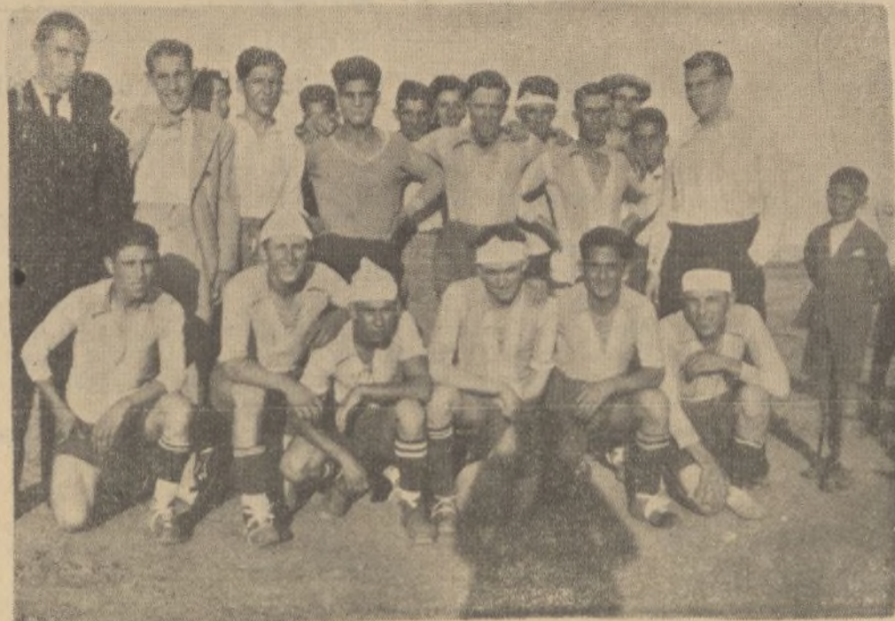
«El C. D. Sanjuanero, que en uno de sus partidos venció al Bollullos F. C. por 1-0, posa para DIARIO DE HUELVA en unión de los jugadores y de nuestro colaborador Malery»

Soy tu adicto, fiel Palma del Condado; Obtengo beneficios hoy en día, No conociendo tanta simpatía En las muchas ciudades que hube estado, Tejo alegre el SONETO improvisado, Ofrenda humilde que hago a tu hidalguía; Al borrarse la pena que traía, La dicha no se aparta de mi lado. Aquí contemplo a la mujer graciosa, Pues su rostro semeja el de una diosa, Alcanzando en belleza lo sublime; La mujer que, si un puro amor imprime, Más linda me parece y más la admiro Al cruzar su mirada en que me inspiro.