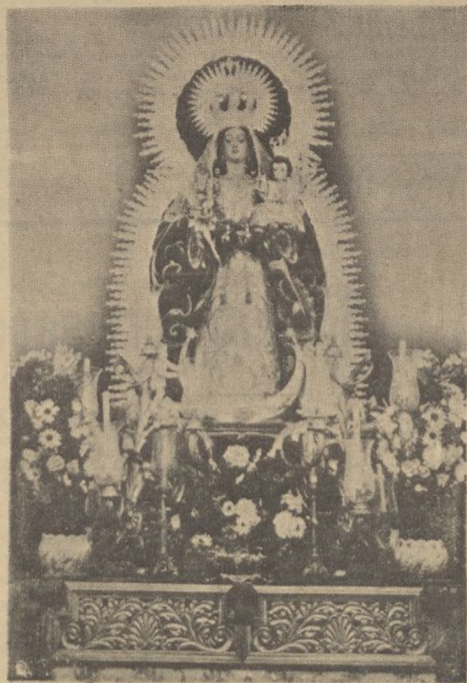
Bellísima imagen de Nuestra Señora del Socorro, patrona de Rociana, que el domingo celebró su fiesta tradicional con inusitado fervor y entusiasmo populares.