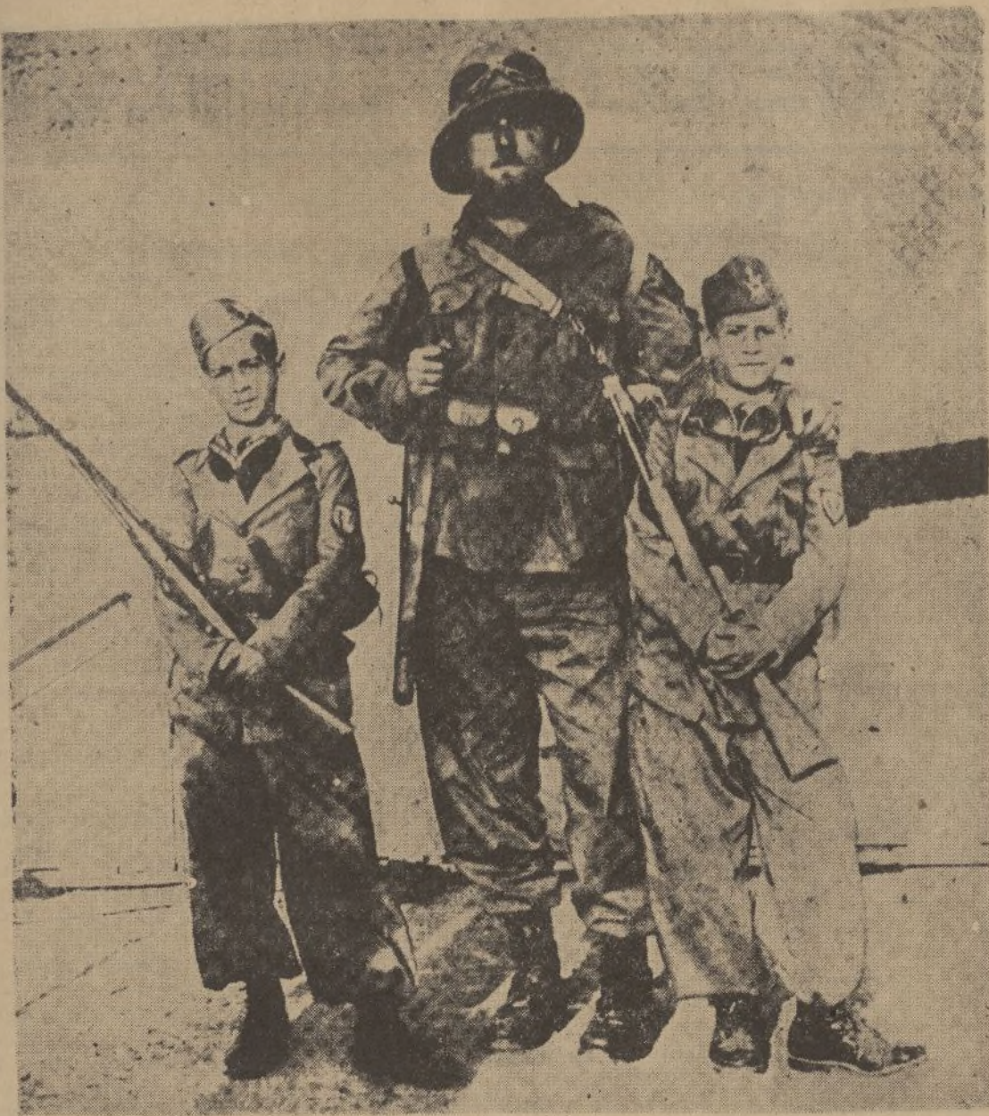
Estos dos muchachos de trece años, a quien acompaña su padre adoptivo, se han presentado voluntarios para hacer la guerra en Etiopía, y esperan en Nápoles el momento de embarcar para el punto a que han sido destinados