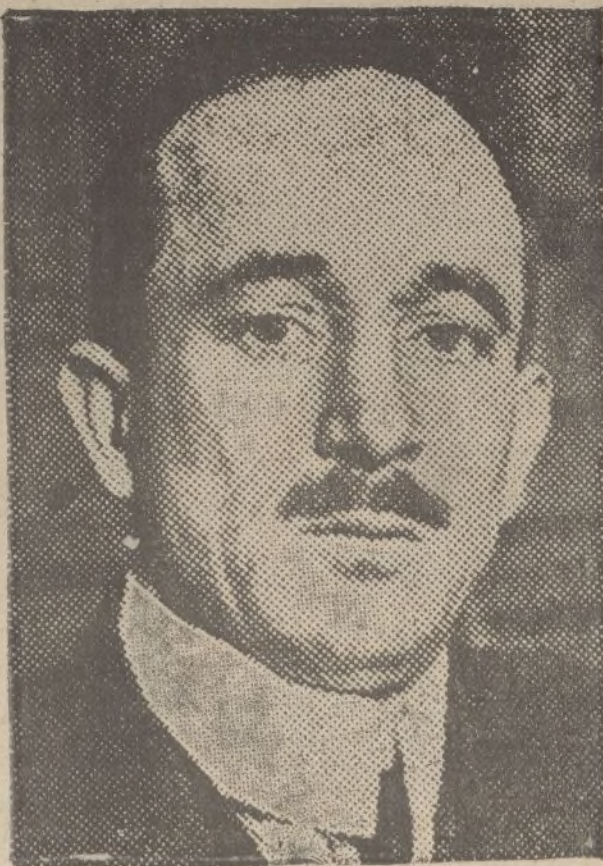
M. Eduardo Benes, presidente por 49 votos de 54 votantes, en la Asamblea de la Sociedad de Naciones.