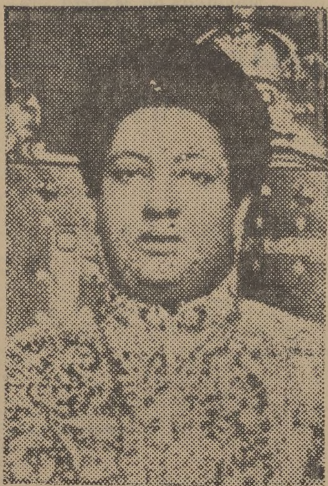
La emperatriz de Abisinia que ha pronunciado un discurso que fué retransmitido por «radio» y destinado especialmente a América.

En Addis Abeba se cree que el emperador pronunciará en breve otro discurso, que también será retransmitido a Europa y que será traducido al francés, alemán o inglés.