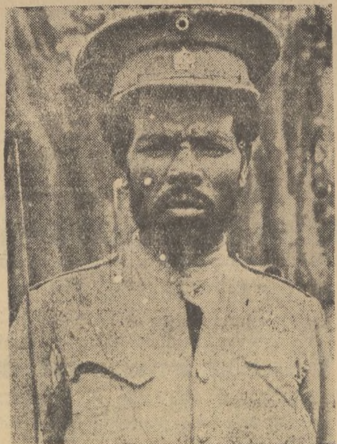
Un soldado abisinio, tipo bien característico de su país.