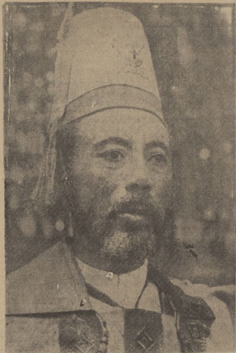
El Ejército regular al servicio de Italia cuenta en Abisinia con fuertes efectivos. La presente «foto» representa a un oficial guerrero del país.