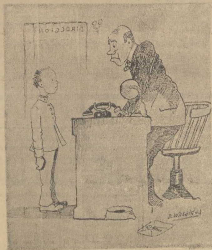
—¿Tú sabes lo que hago yo con los botones embusteros? —Sí, señor: hacerlos comisionistas.