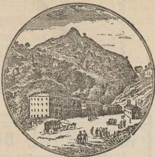
Gran perspectiva del balneario