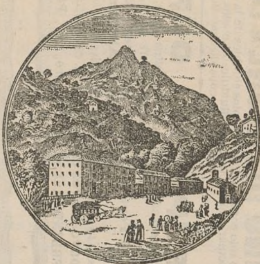
Gran perspectiva del balneario