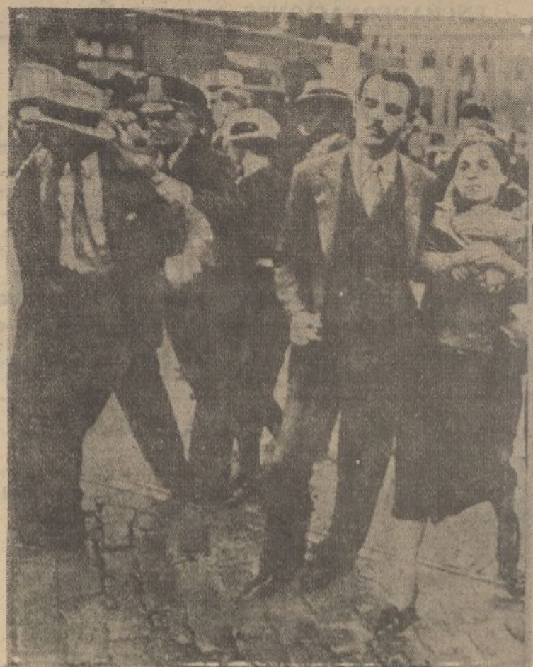
En Chicago numerosas personas intentaron realizar una manifestación a favor de Etiopía. Prontamente acudieron 750 agentes de Policía, siendo muy violento el encuentro entre manifestantes y policías. En la «foto» se ve cómo las mujeres tomaron parte activa en la manifestación.