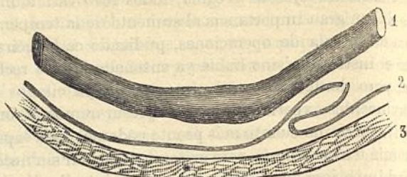
Fig. 6. 1. Intestino. — 2. Peritoneo. — 3. Pared abdominal.

El desagüe no expelía ninguna secrecion, por lo cual, cuando se sustituía el vendaje (lo que materialmente tenía lugar siempre bajo la accion del pulverizador), fué