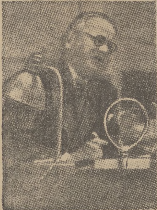
El delegado soviético Litvinoff, en el acto de pronunciar su discurso en la Sociedad de Naciones, provocando una enérgica protesta por parte del representante de Polonia, Beck.