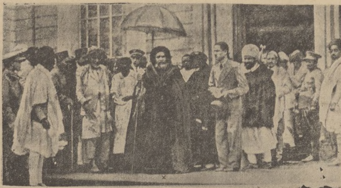
El Negus, Hailes Selassie, saliendo de un templo católico en el que se habían dedicado oficios religiosos a la conservación de la paz tan amenazada en el presente