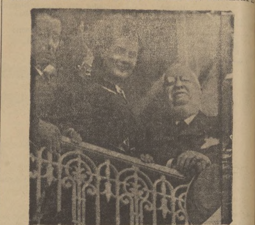
Desde el balcón de su casa «Miss Europa» saluda al pueblo.-Está acompañada del comandante militar de Canarias y del alcalde de Santa Cruz.

do después de varios pinchazos. Puede asegurarse, sin equivocarse, que esta ha sido la corrida más grande que desde hace mucho tiempo se ha visto en Aracena, se corrió ayer, tanto por los toreros como por el ganado, el cual fué muy aplaudido en el arrastre.