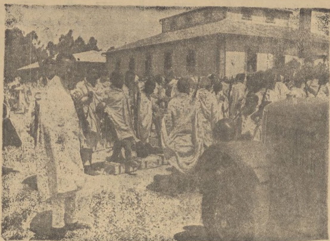
Los etíopes esperan la guerra.-Acaba de llegar a Addis Abeba un camión cargado de armas y municiones.