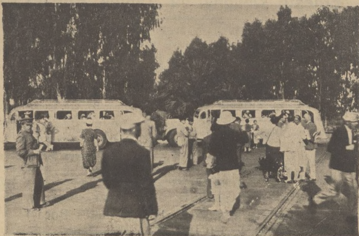
Los turistas del buque yugoeslavo suben a los excelentes autocars de la Empresa Automovilista Internacional para dirigirse a Sevilla