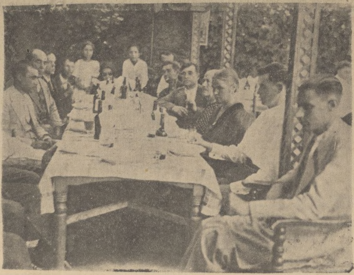
Grupo de ciegos, acogidos al Patronato, almorzando en el restaurante de Alpresa para celebrar la constitución de dicha entidad

Aun quedan muchas reservas de su altruismo.