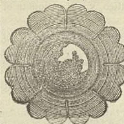
MODELO DEL APARATO

de A. BESLIER, 40, rue des Blancs-Manteaux, PARIS