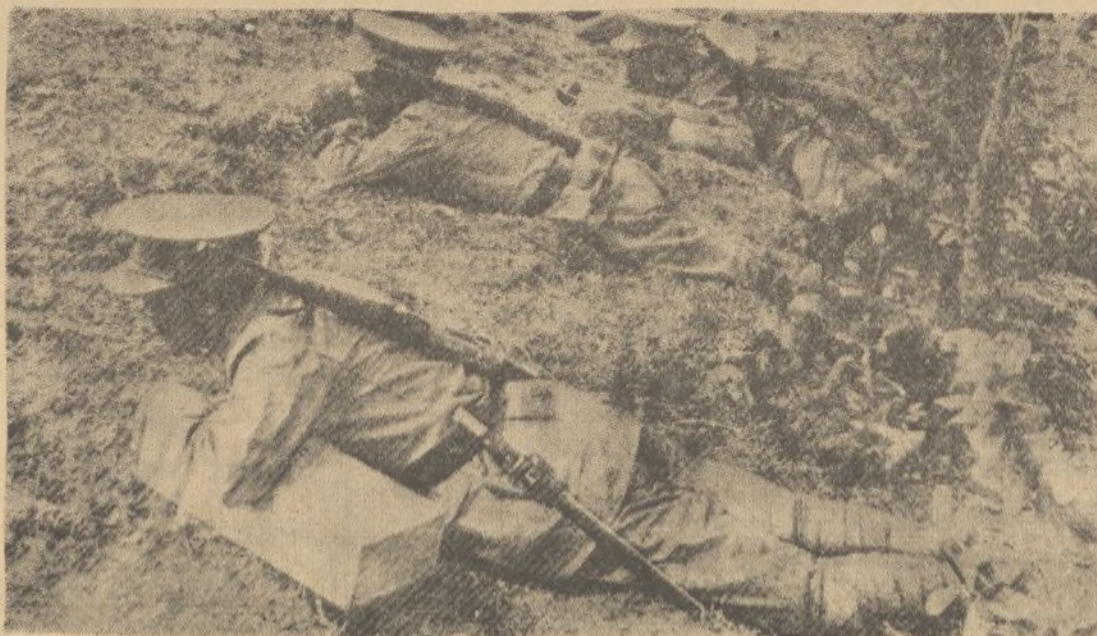
Las tropas de Etiopía se pertrechan con material moderno, y constantemente realizan ejercicios guerreros