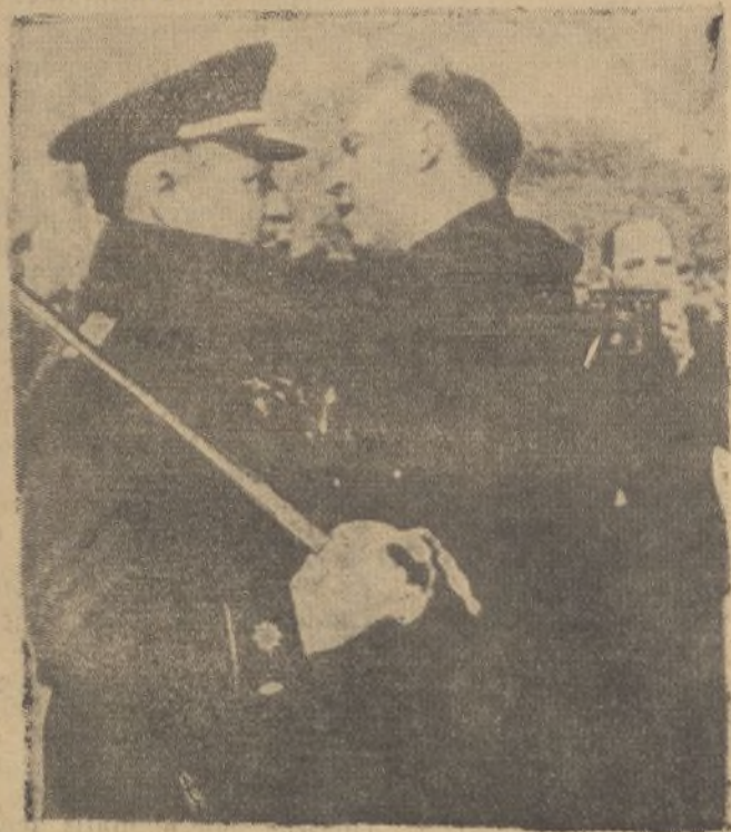
El ministro de la Gobernación, impone la insignia de la Encomienda de la Orden de la República al teniente coronel jefe de las fuerzas de Asalto