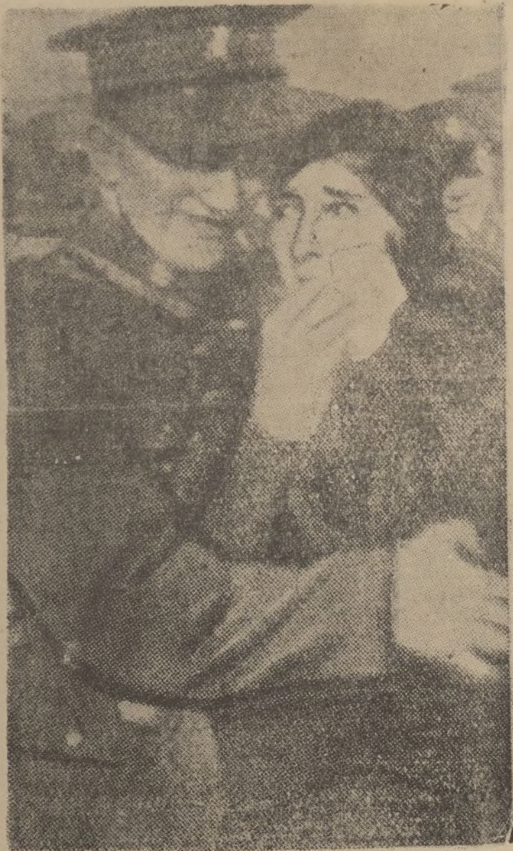
Emocionante escena de una madre despidiendo a su hijo soldado, que parte con las fuerzas expedicionarias inglesas a Egipto