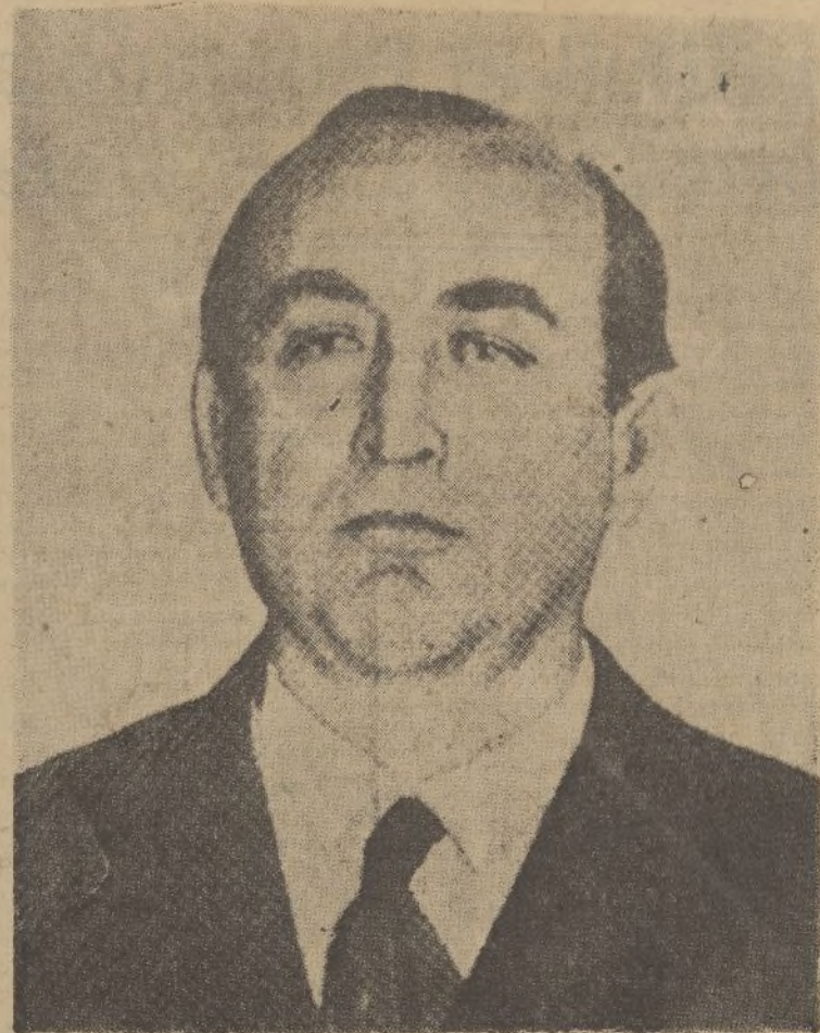
El Sr. Gomboes, presidente del Consejo de Ministro de Hungría