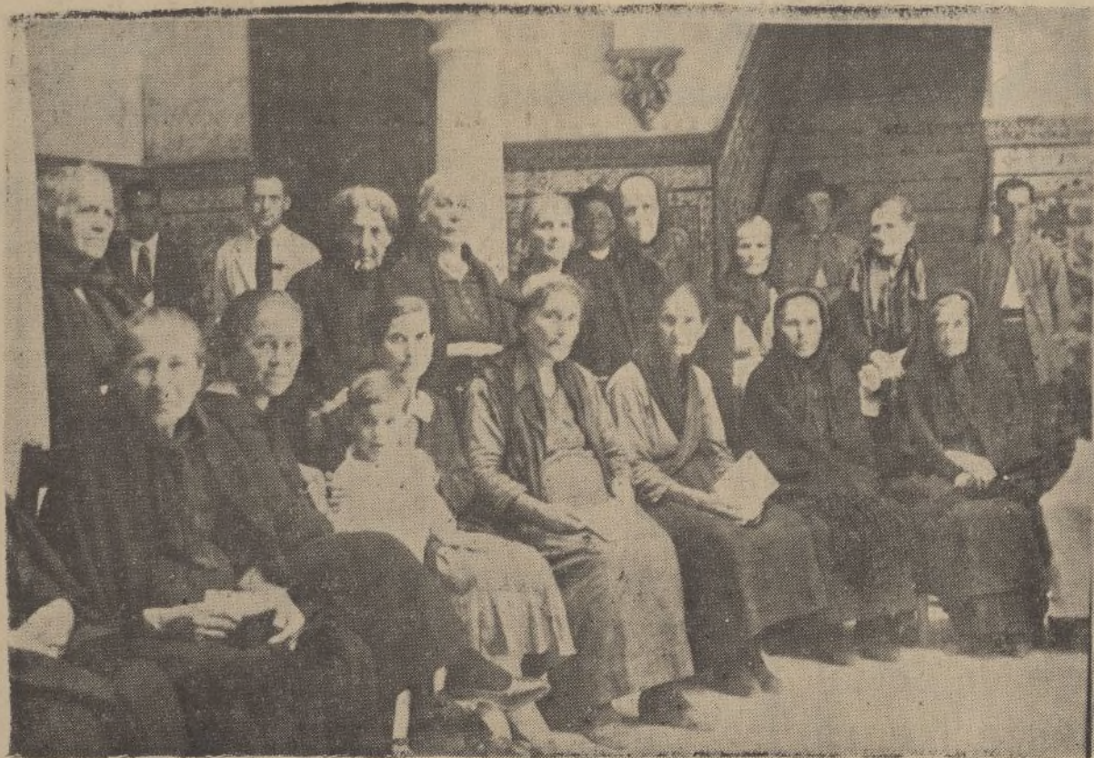
Grupos de obreros ancianos que en el acto celebrado en Ayamonte recibieron la bonificación de 400 pesetas