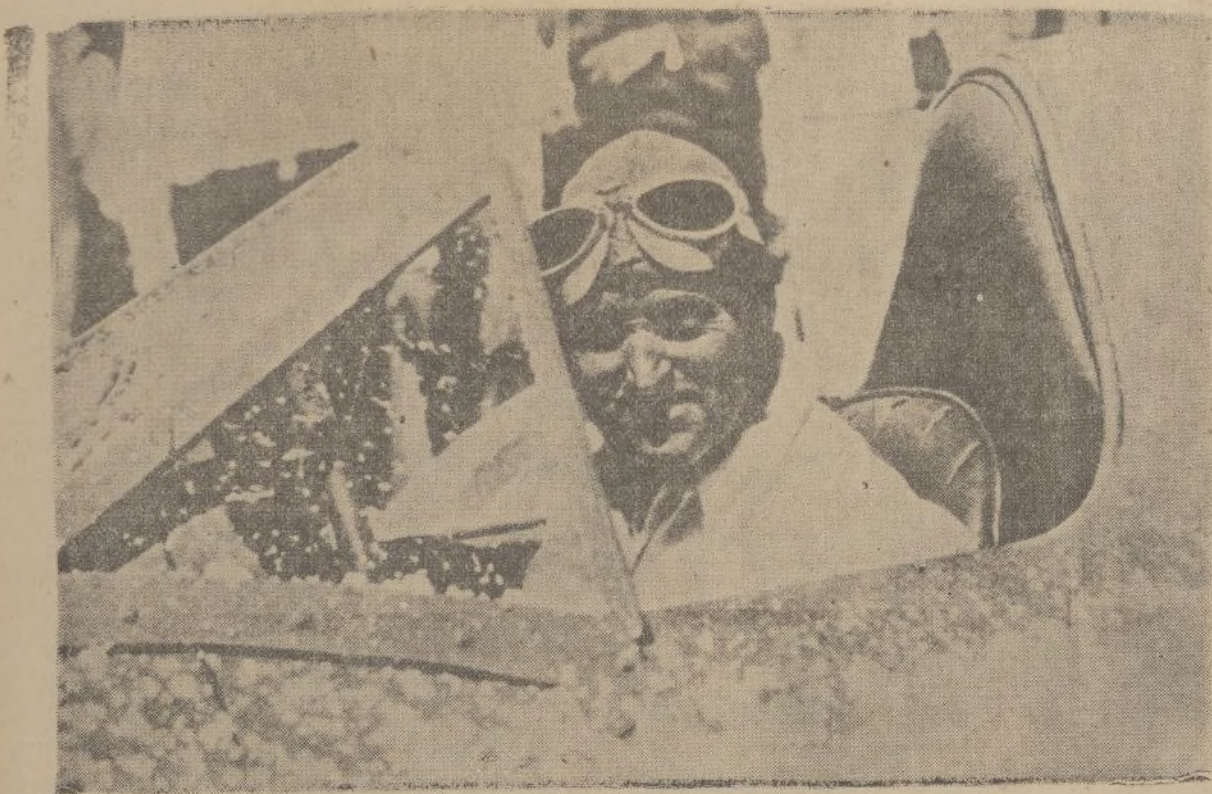
El famoso corredor Sr. Malcolm Campbell, que conduciendo su «Pájaro Azul» ha alcanzado una velocidad de 563 kilómetros por hora, en la pista de Utah (E. Unidos)

Brillie", 134,493, y el segundo con "Ford", 147,014.