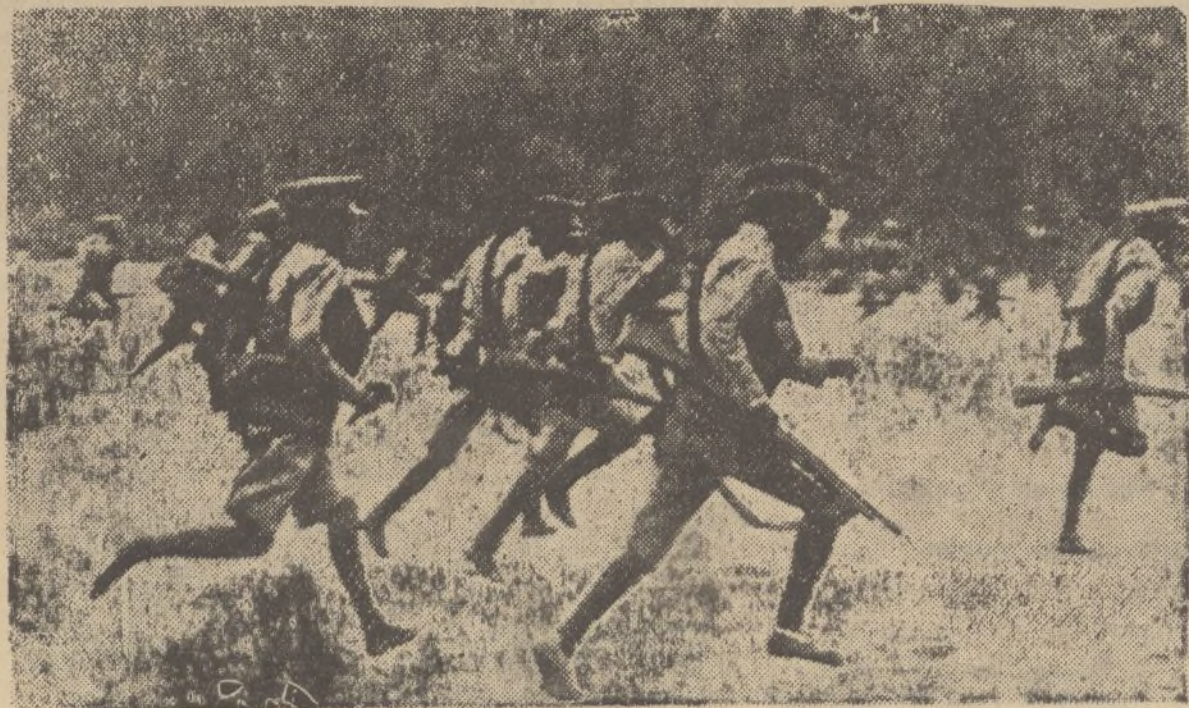
El adiestramiento bélico de la infantería regular de Abisinia es continuo en estos días.-Los soldados hacen constantes ejercicios, maniobras y simulacros de combate con miras a la guerra que, fatalmente, ha comenzado