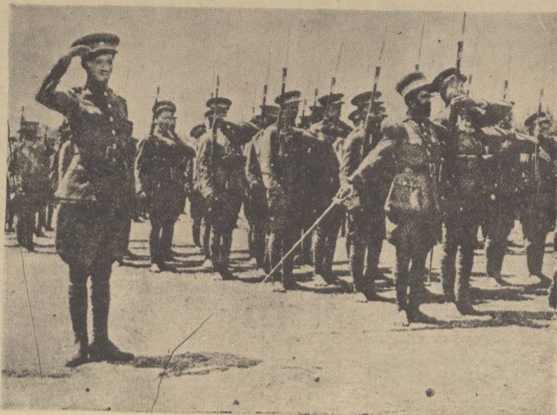
Recientemente en Addis Abeba se ha celebrado una revista de tropas equipadas e instruidas por oficiales europeos. Los soldados aparecen descalzos para su mejor facilidad en la marcha a través de los campos y terrenos accidentados