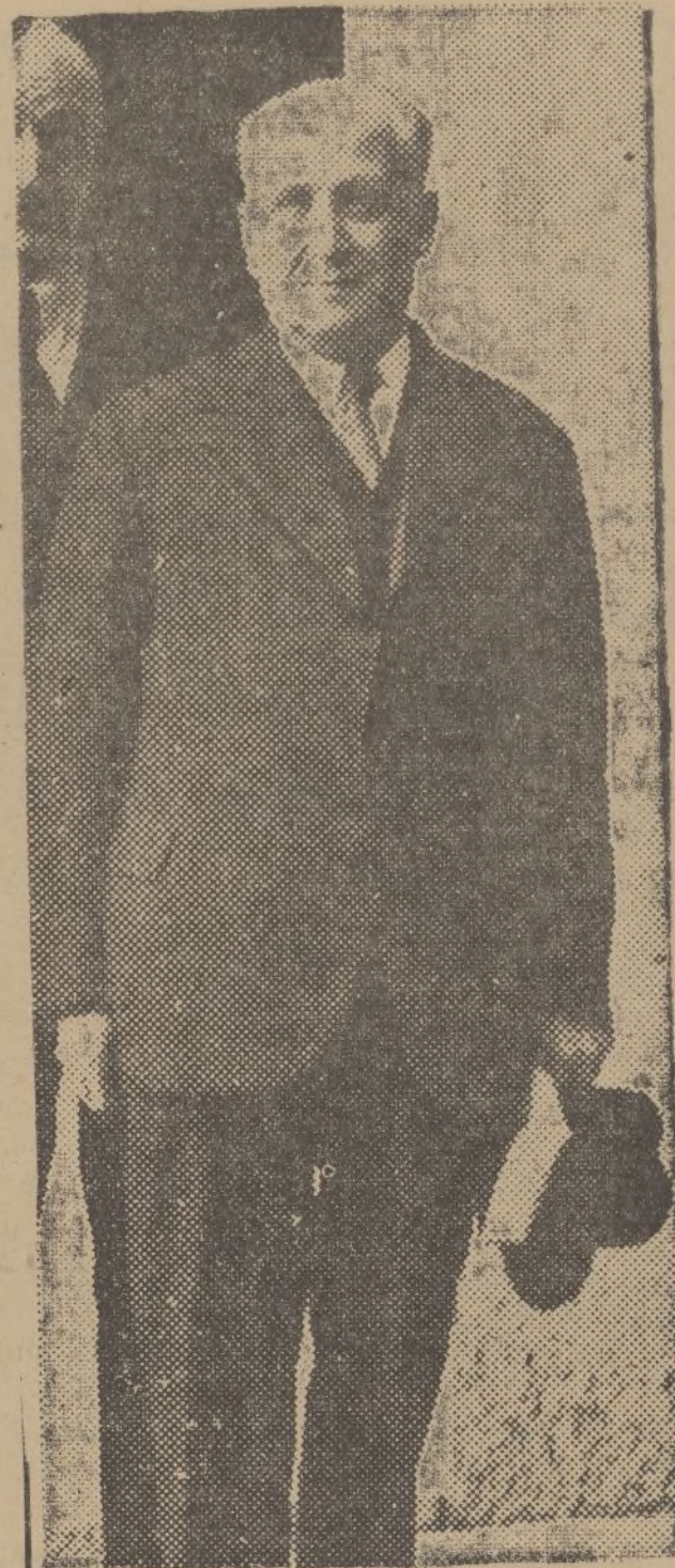
El señor Largo Caballero, es sorprendido por los reporteros gráficos a la salida de la cárcel, por habérsele concedido, de momento, prisión atenuada.

El echo de haberse unido Alemania con Inglaterra en el común deseo de abolir, por completo, el arma submarina, representa ya una de estas etapas. Verdad es que sólo podrá adquirir importancia práctica cuando todas las naciones estén acordadas en este punto, pero ya es algo que en una cuestión tan di-