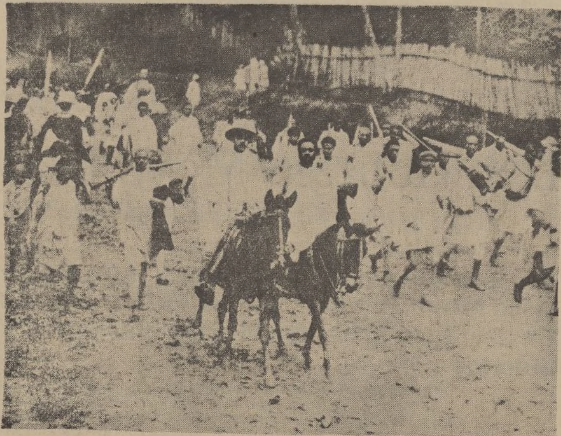
Los abisinios se movilizan, pues están dispuestos a resistir la invasión. Grupos de hombres, con sus trajes típicos y fusiles, caminan a ocupar los lugares desde donde lucharán por la independencia de su territorio