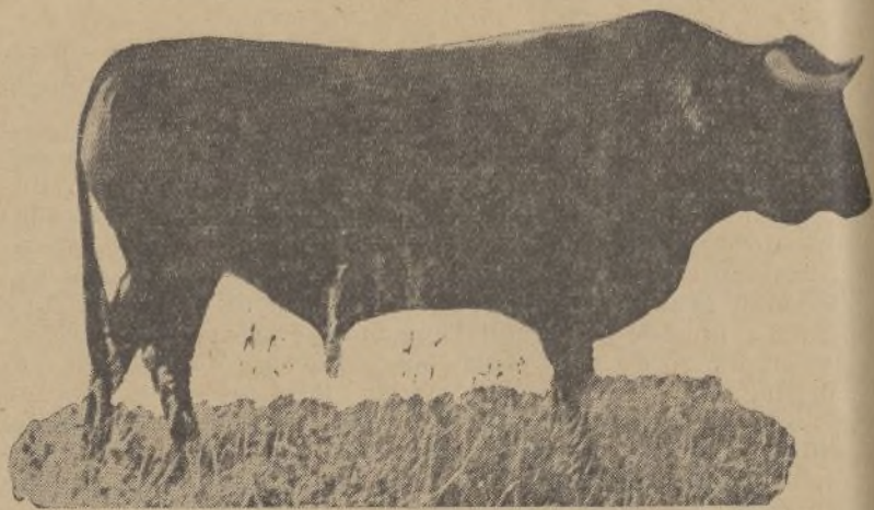
Número 1. Golondrino