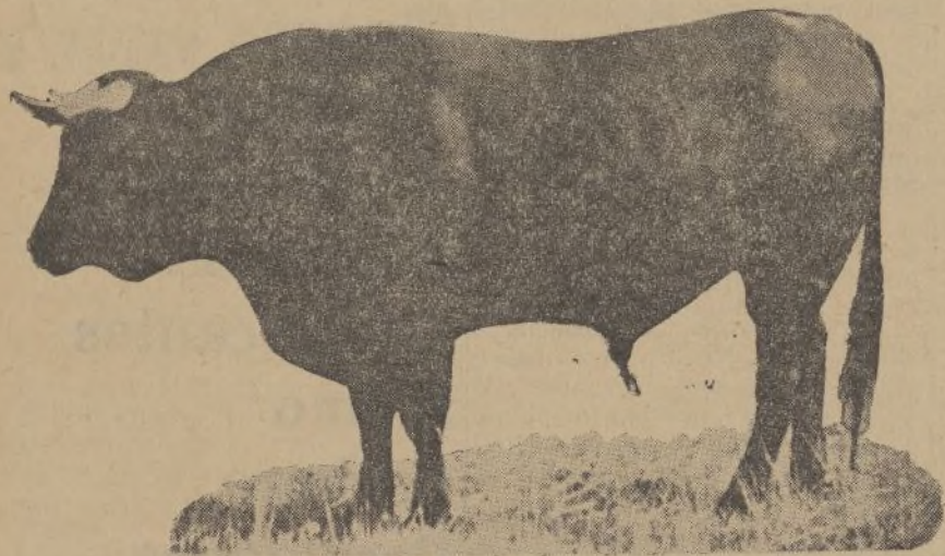
Número 105. Fandanguero