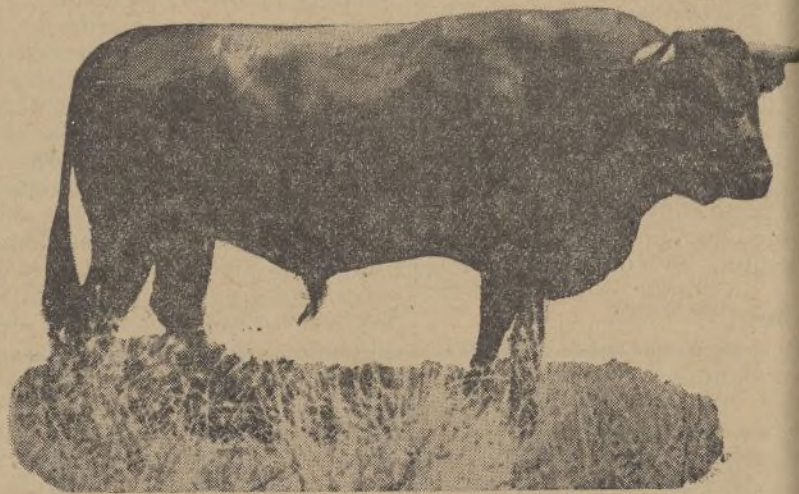
Número 64. Ojalado