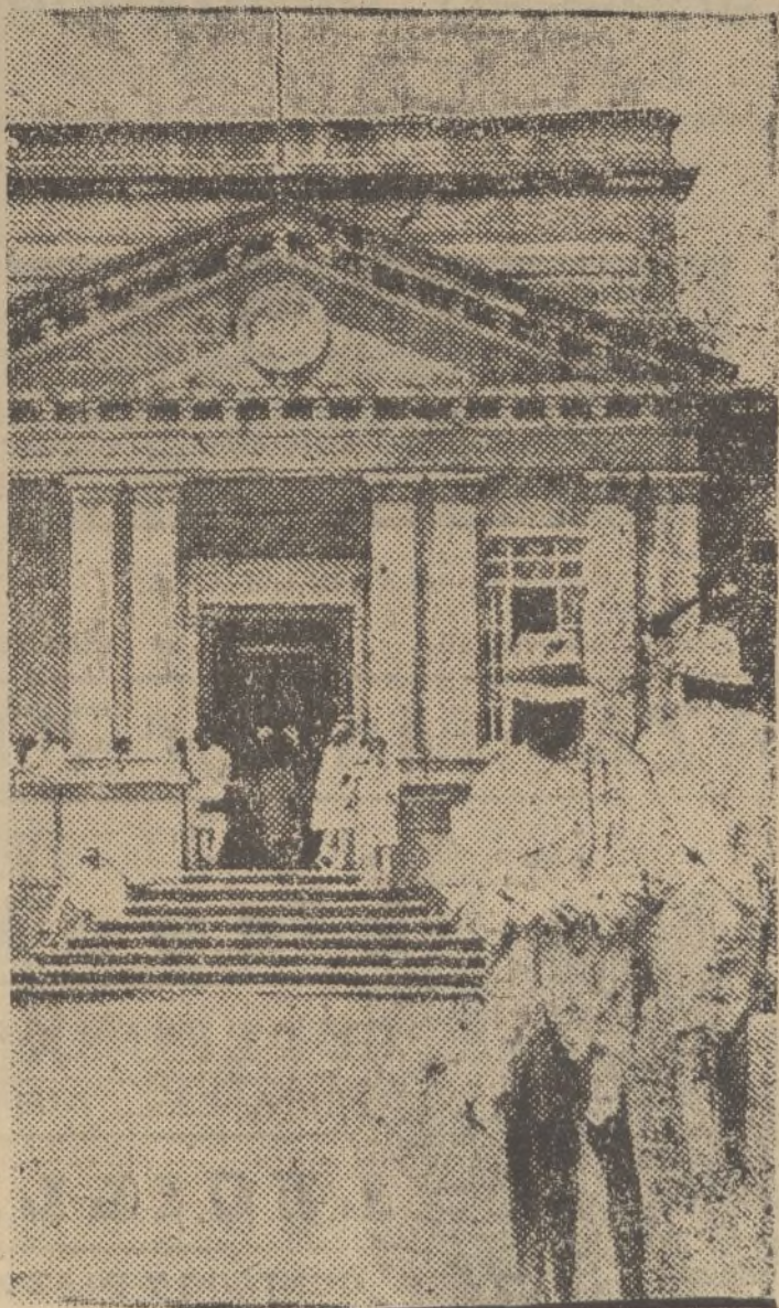
El Banco Nacional de Etiopía, que radica en Addis Abeba