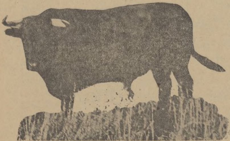
Número 88. Cubano