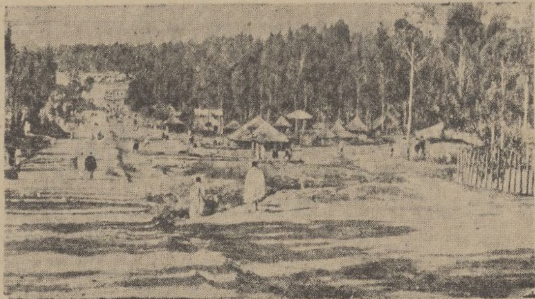
Esta agrupación de chozas sobre fondo de selva salvaje es una aldea abisinia