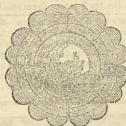
MODELO DEL APARATO

de A. BESLIER, 40, rue des Blancs-Manteaux, PARIS