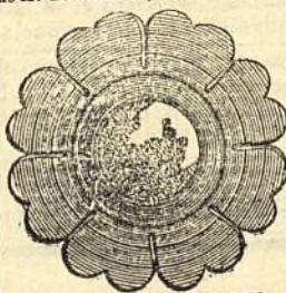
MODELO DEL APARATO

MODELO PEQUEÑO: diametro (7 centímetros y 1/2)