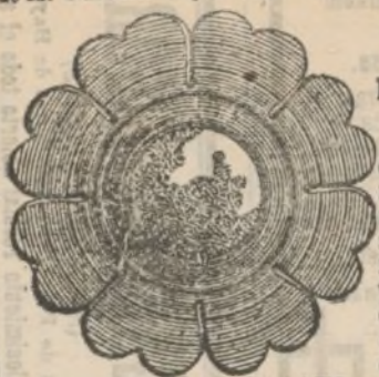
MODELO DEL APARATO

de A. BESLIER, 40, rue des Blancs-Manteaux, PARIS