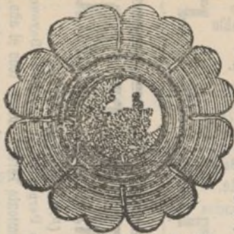
MODELO DEL APARATO

de A. BESLIER, 40, rue des Blancs-Manteaux, PARIS