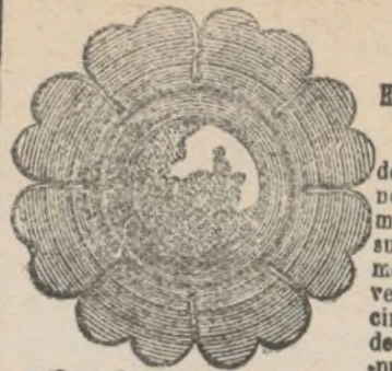
MODELO DEL APARATO

de A. BESLIER, 40, rue des Blancs-Manteaux, PARIS