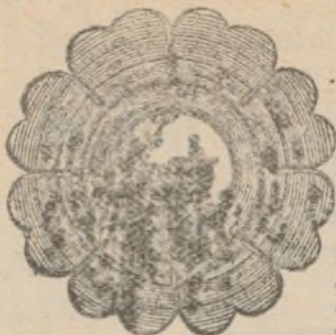
MODELO DEL APARATO

de A. BESLIER, 40, rue des Blancs-Manteaux, PARIS