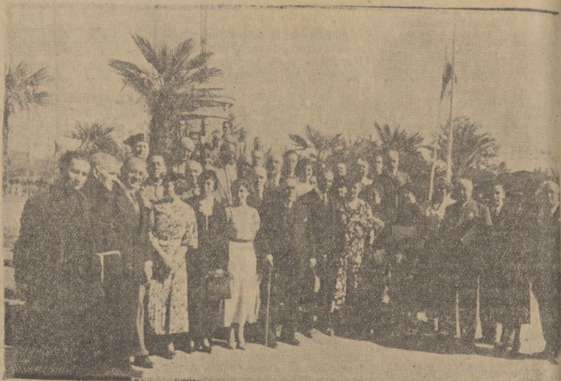
Los delegados del Congreso Americanista, con las autoridades onubenses, «posan» ante la Cruz del Monasterio de la Rábida

Tal emoción causó en mí este suceso, que estuvimos va rios días sin trabajar y de la impresión me puse enfermo