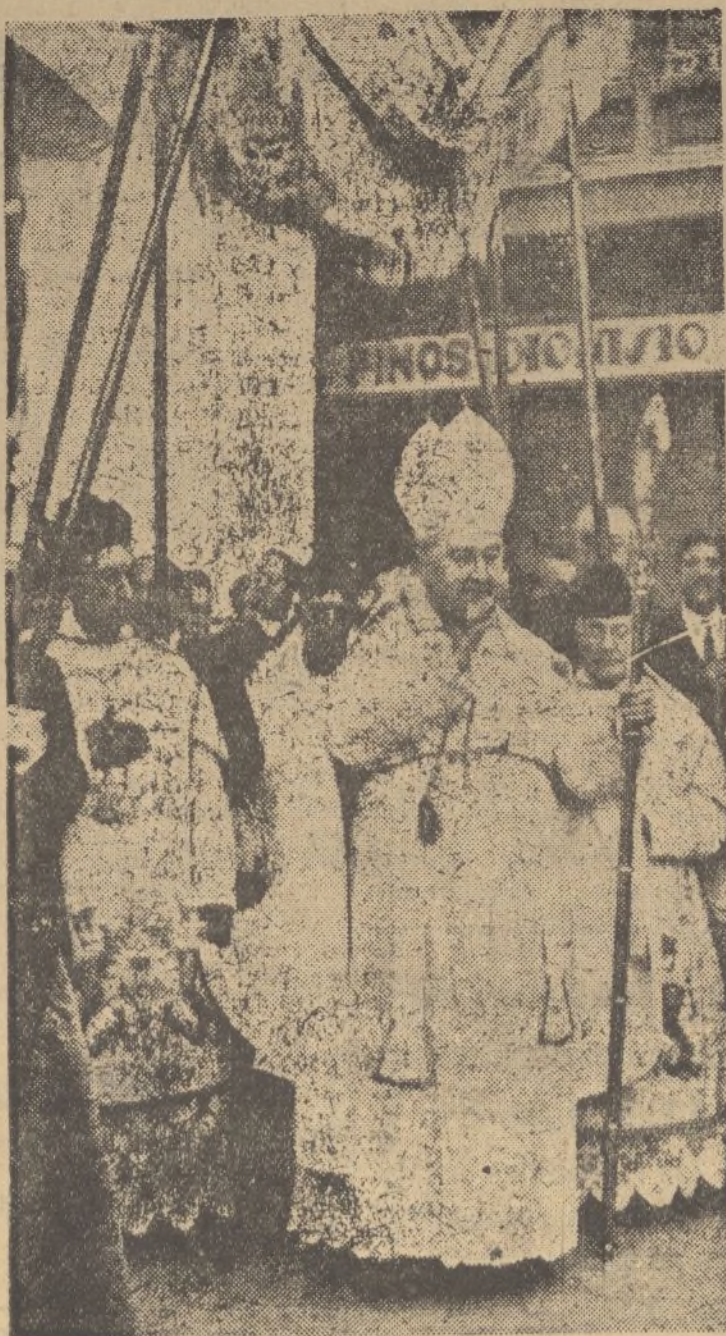
El nuevo obispo de Palencia, doctor don Manuel González García, hace, bajo palio, su entrada triunfal en la diócesis, bendiciendo al pueblo que le aclama a su paso por las calles.