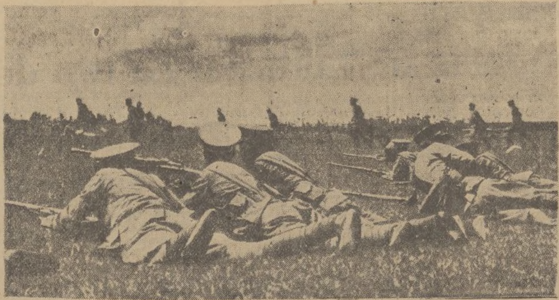
Los etíopes provistos de fusiles y de ametralladoras, defienden la independencia de su país.

La construcción y aplicaciones de microscopios. Por Aurelio R. Charantón. De venta en la Papelería del DIARIO DE HUELVA