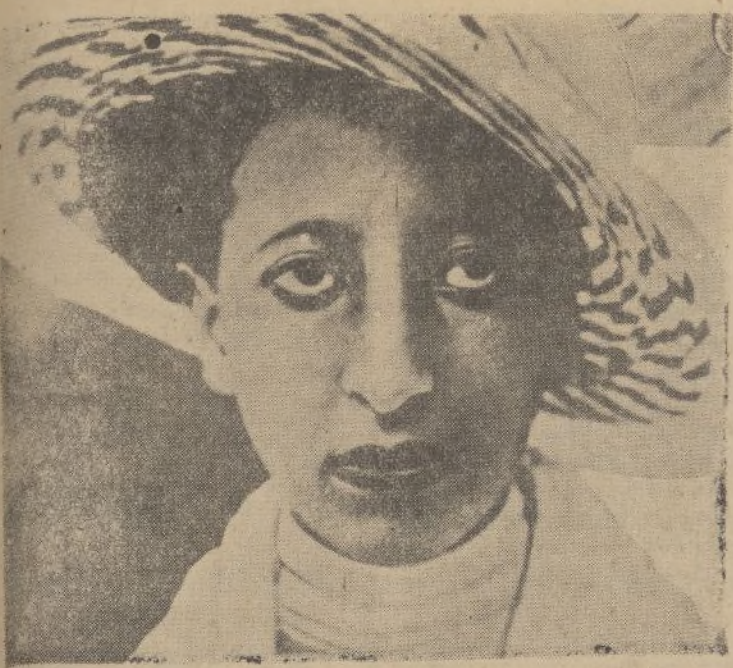
La hija del Negus de Abisinia, vestida a la europea