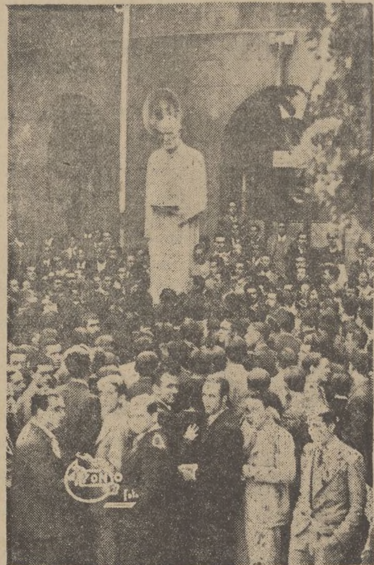
Los estudiantes de la Facultad de Medicina de San Carlos, se reúnen en torno de la estatua de Ramón y Cajal para rendir un homenaje al inolvidable maestro y gran sabio