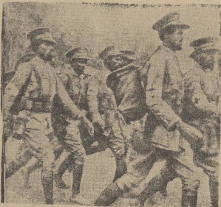
En Addis Abeba se ha creado un regimiento de la Cruz Roja que ha marchado al frente para auxiliar a los heridos