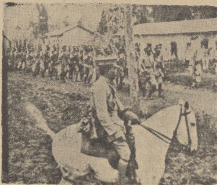
Por las calles de Addis Abeba desfilan las fuerzas de regulares, dispuestas para salir al frente

Teléfonos, 1915-1994 Apartado, 36 HUELVA