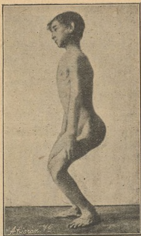
Figura 2. a

valgum. Como este enfermo parece que anda en cuclillas, figura 2. a , al pronto la impresión que da no es de genu-valgum, sino más bien de contracturas de los