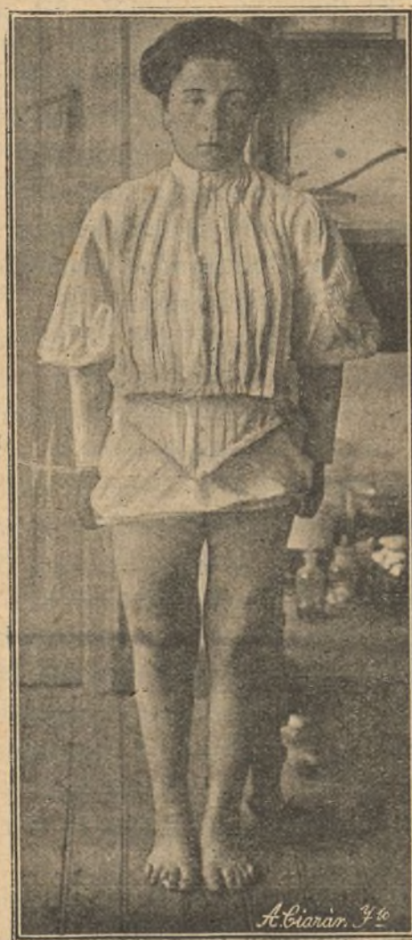
Figura 4. a

En estos casos, la rectificación del eje y de los fémures ó de las tibias aisladamente es insuficiente; hay que hacer cuatro osteotomías, dos de los fémures y dos de las tibias. Comenzamos por rectificar los fémures con dos osteotomías lineales supracondíleas, atacando el hueso por el lado externo y en pleno tejido epifisario, concluyendo la fractura con la mano. Operé los dos muslos en una sesión y coloqué un vendaje de escayola desde el pie hasta la ingle. Al mes y medio se levantó el apósito y la herida estaba bien cicatrizada, dando de alta al enfermo por cerrarse el Instituto los meses de verano, con intención de admitirle en Octubre y operarle las dos tibias.