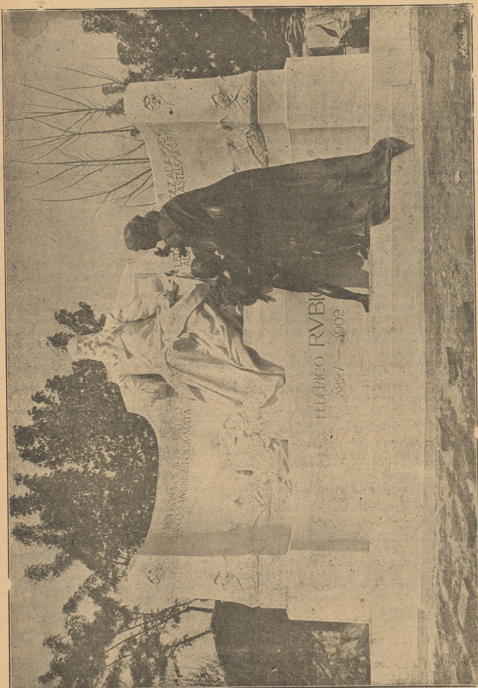
Aspecto general del monumento.