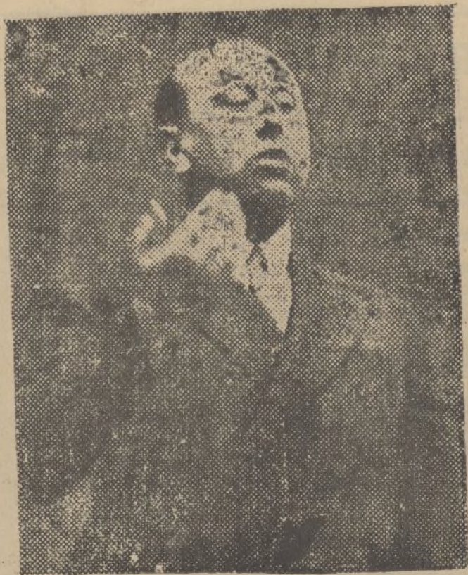
El señor Gil Robles se dirige a las derechas autónomas vascas en su discurso, pronunciado el pasado domingo en San Sebastián

«Raudwijk», holandés, para Gante, con mineral.