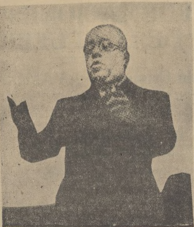
Don Manuel Azaña, en uno de sus gestos, durante el discurso pronunciado en Madrid el pasado domingo, en un acto de izquierda