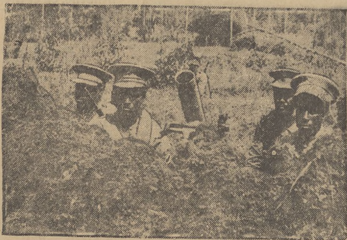
También los etíopes tienen cañones antiaéreos, que ocultan en los oasis de los alrededores de Harrar para combatir a los invasores