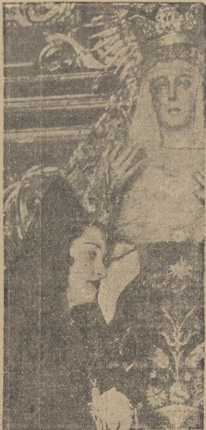
La guapísima Carmen Díaz — que ayer repitió sus éxitos en el Gran Teatro — durante su pasada estancia en Sevilla, es nombrada hermana honoraria de la popular Cofradía de la Macarena. — En la "foto" aparece la eminente actriz, rezando una oración ante la Virgen de la Esperanza, después de la ceremonia