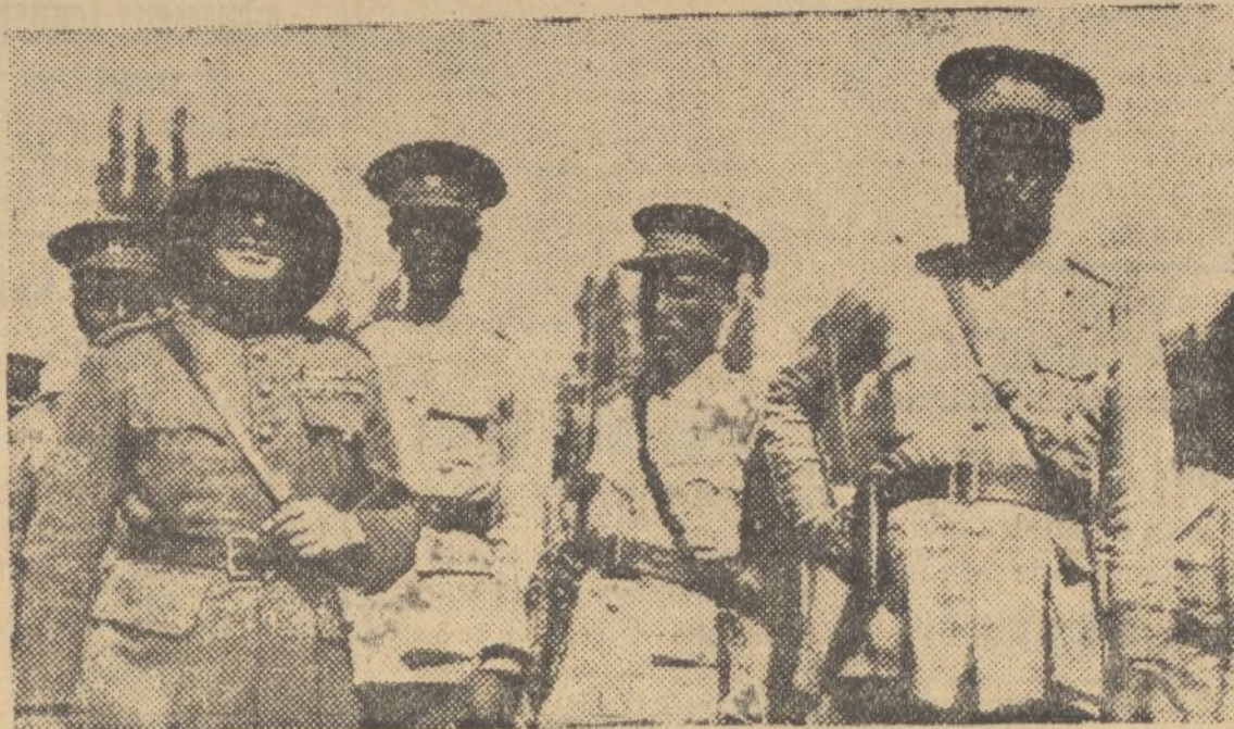
Los oficiales de las tropas regulares del Negus, con uno de los militares belgas, instructor de los soldados etíopes

Contribuirá Vd. a extirpar la mendicidad callejera, si envía sus limosnas directamente a la ASOCIACION ONUBENSE DE CARIDAD