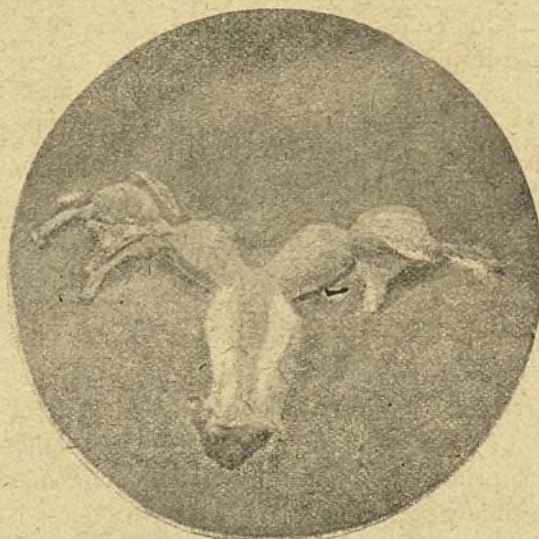
FIG. 1. a

La región inferior ó vaginal está ocupada por dos orificios vaginales, uno anterior y otro posterior, perfectamente diferentes y distintos, que vienen á abrirse en este punto, con un tabique intervaginal completo (figura 1. a ). Después se hallan la fosa navicular anterior, el periné y el ano. Las dos vaginas están formadas por dos conductos membranosos extendidos desde la vulva á cada uno de los úteros, representando también dos conductos excretores y dos órganos