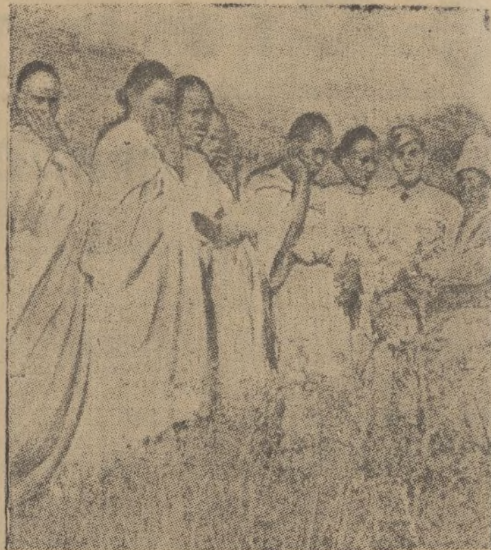
Las mujeres de Adua flirtean con los soldados extranjeros, invasores de su patria.