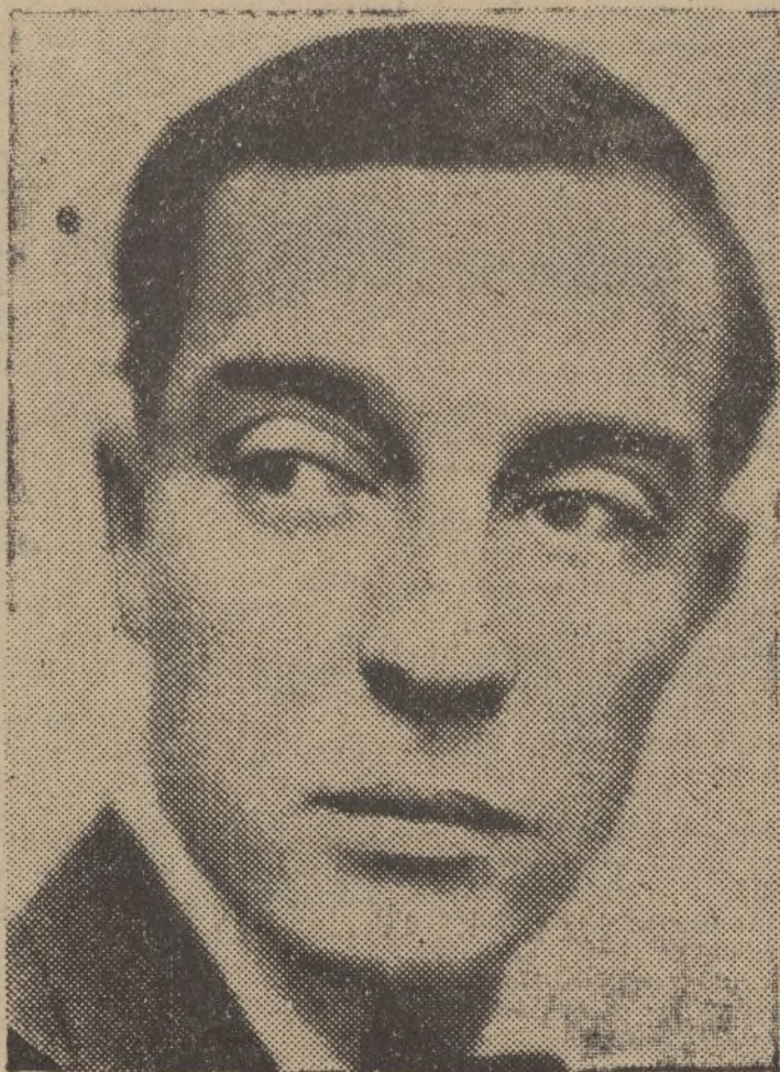
Buster Keaton «Pamplinas», el popular actor cinematográfico, que ha sido recluido en una casa de salud, víctima de un fuerte ataque de locura.