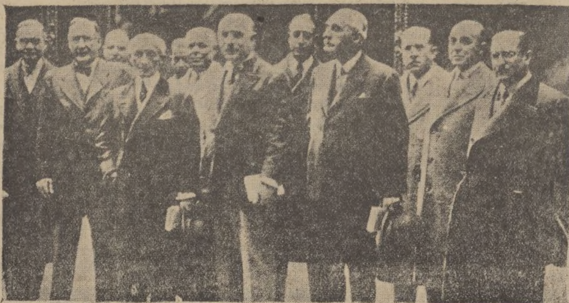
Los concejales del Ayuntamiento de París, que se encuentran en Madrid, en su visita al Museo del Prado

¿Qué hacen los países inteligentemente regidos sino exportar, exportar y exportar aquello