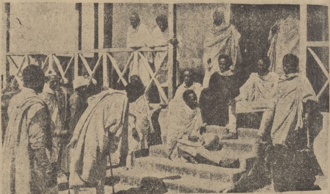
El Tribunal Popular actúa en Etiopía. Un juez administra justicia en nombre de su «Ras»