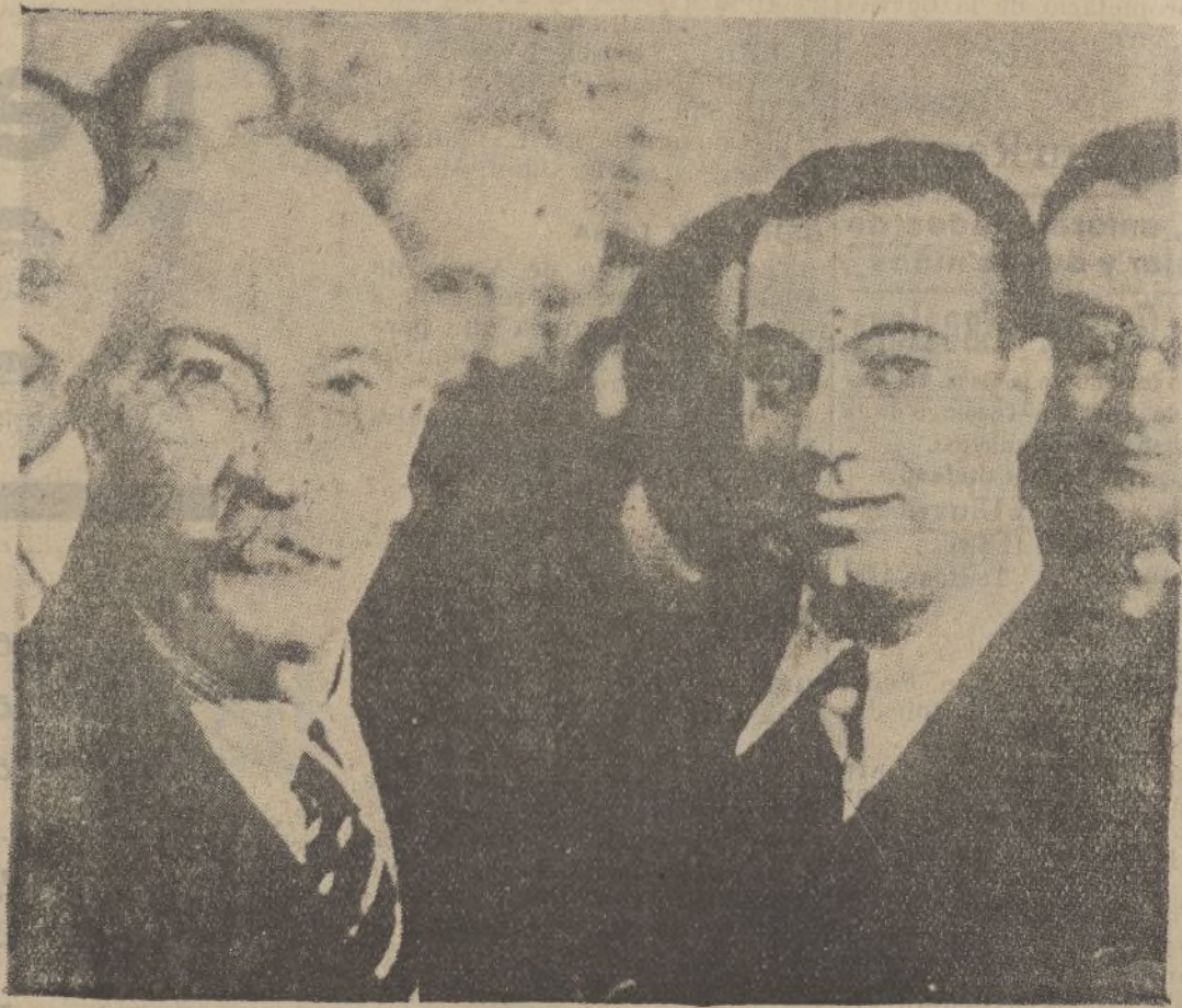
Diputados y periodistas rodean constantemente a don Alejandro Lerroux, en espera de unas declaraciones relacionadas con el momento político

—¡Mira que vender la mesa del comedor! —¿Y que vas a hacer sin ella? —Pues lo que no puedo hacer con ella: ¡Comer!