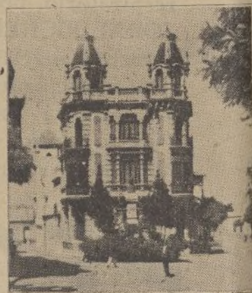
Una vista de la calle Pí y Margall