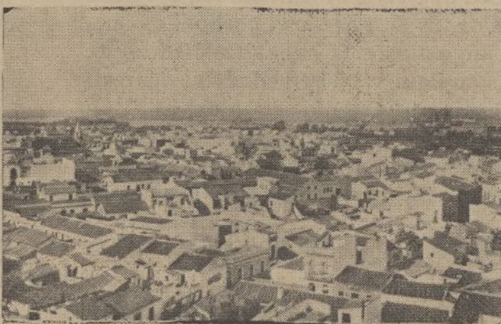
VISTA PARCIAL DE LA CIUDAD