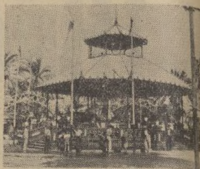
La Plaza de la República, en fiestas.