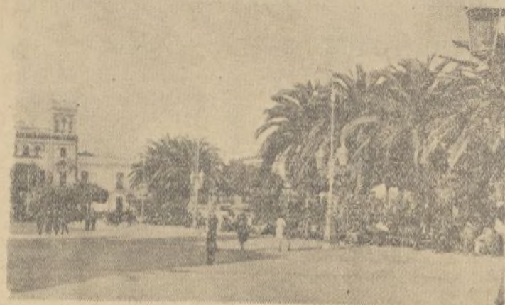
PLAZA DE LA CONSTITUCIÓN

Ferretería y Quincalla Material eléctrico Artículos viaje Radios, Gramolas y Discos HUELVA