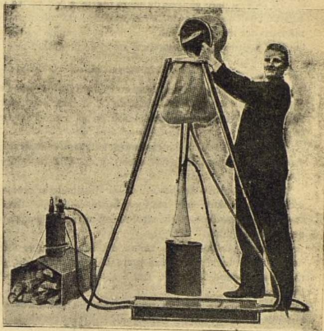
FIG. 2. a

El recipiente es un saco de lona reforzada é impermeabilizada, que se coloca sobre el trípode á una altura del suelo de un metro setenta centímetros.