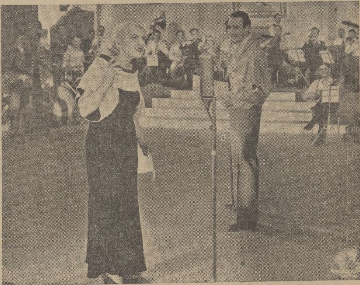
Una escena de la magnífica producción Cifesa, «Radio Revista 1935»