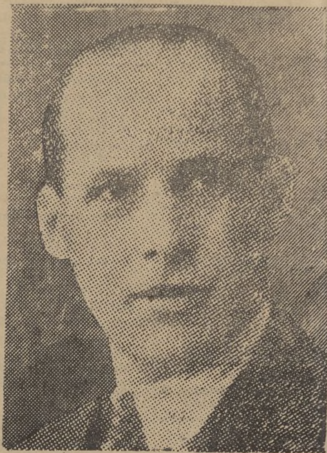
Una de las más recientes fotografías del Rey Jorge que ceñirá la corona de Grecia, por expresa voluntad del pueblo, según el plesbícito celebrado en aquel país