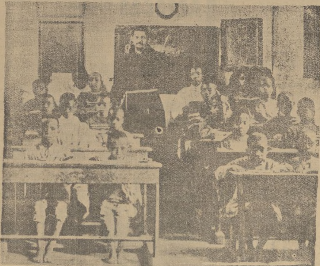
La guerra contra el analfabetismo y la incultura es la única que hoy debe admitirse por los países civilizados.—Los misioneros católicos sostienen en Abisinia escuelas como las del presente cliché