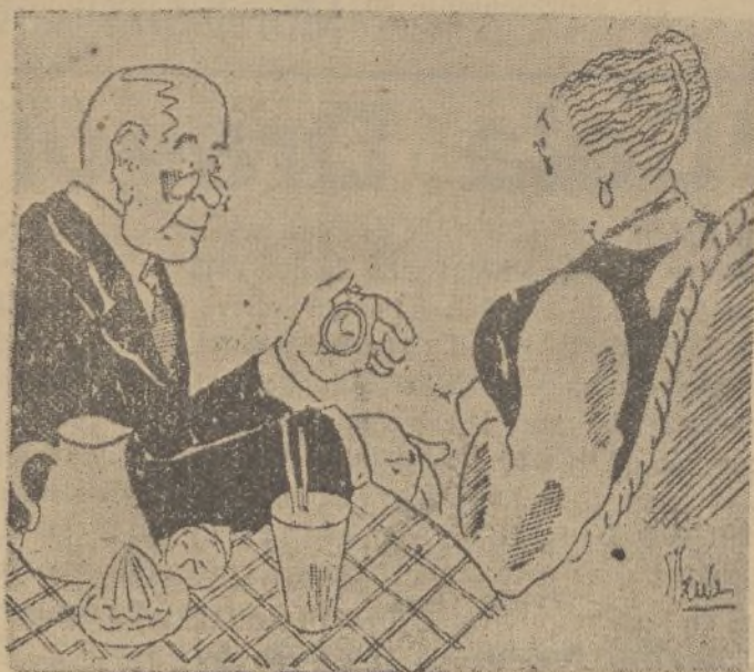
“RECORD” CONTRA EL RELOJ

¿Para qué sacas el reloj cuando comienzo a hablar?