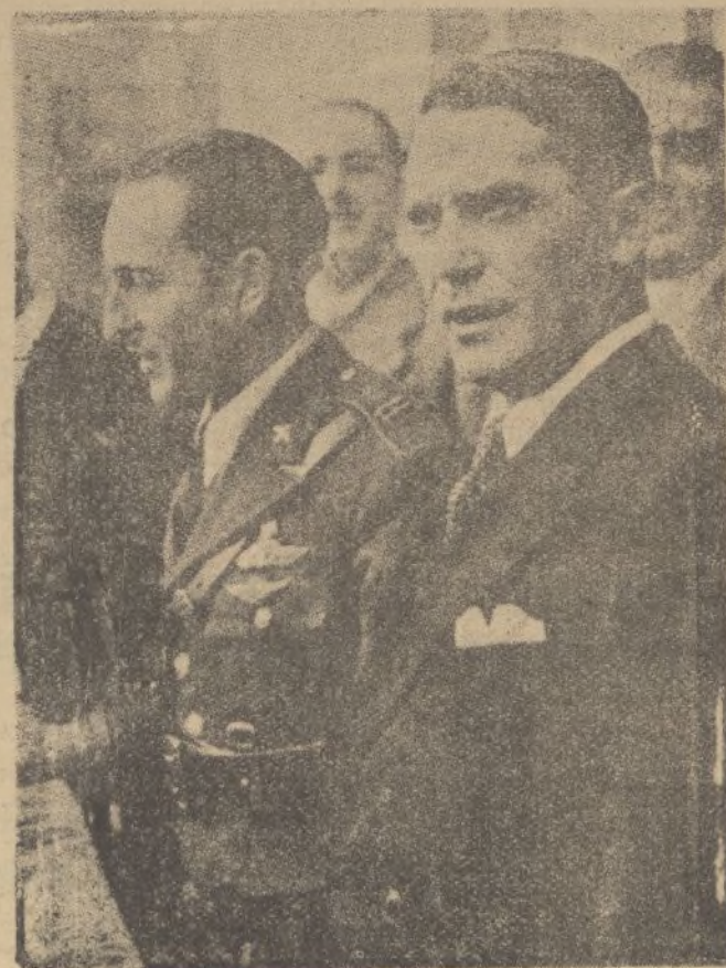
El aviador Pombo es objeto de constantes agasajos y muestras de simpatías en Santander.

«Pero, hombre, si es que la gente se asusta de cualquier cosa! Yo voy más seguro y tranquilo en un aparato que en una bicicleta. Escuche. Aunque uno se quiera caer no se cae. Además, no hay el peligro de volcar en una cuneta, ni estrellarse contra un árbol, ni atropellar