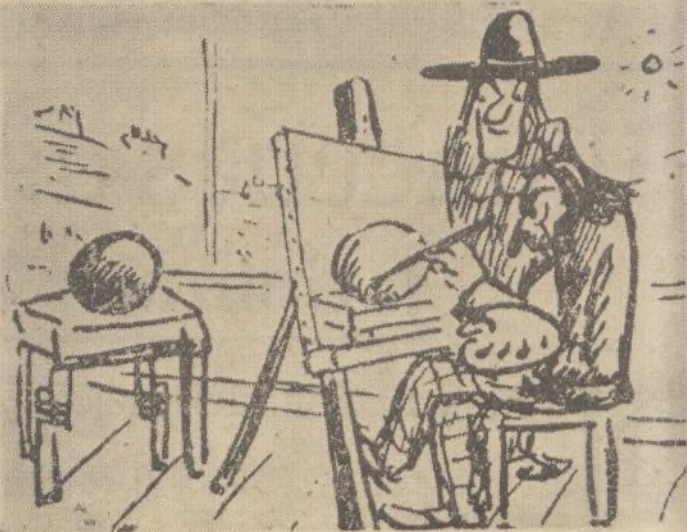
—Y dices que tienes hambre teniendo a mano un queso? —Tengo que conservarlo, porque me sirve de modelo.

EL BARATO Precios únicos. Algo que no era conocido y que solo favorece al consumidor.