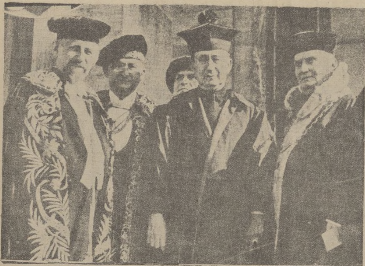
El insigne inventor Guillermo Marconi reunido con varios doctores de la Universidad de Roma, con motivo de la inauguración de la Ciudad Universitaria