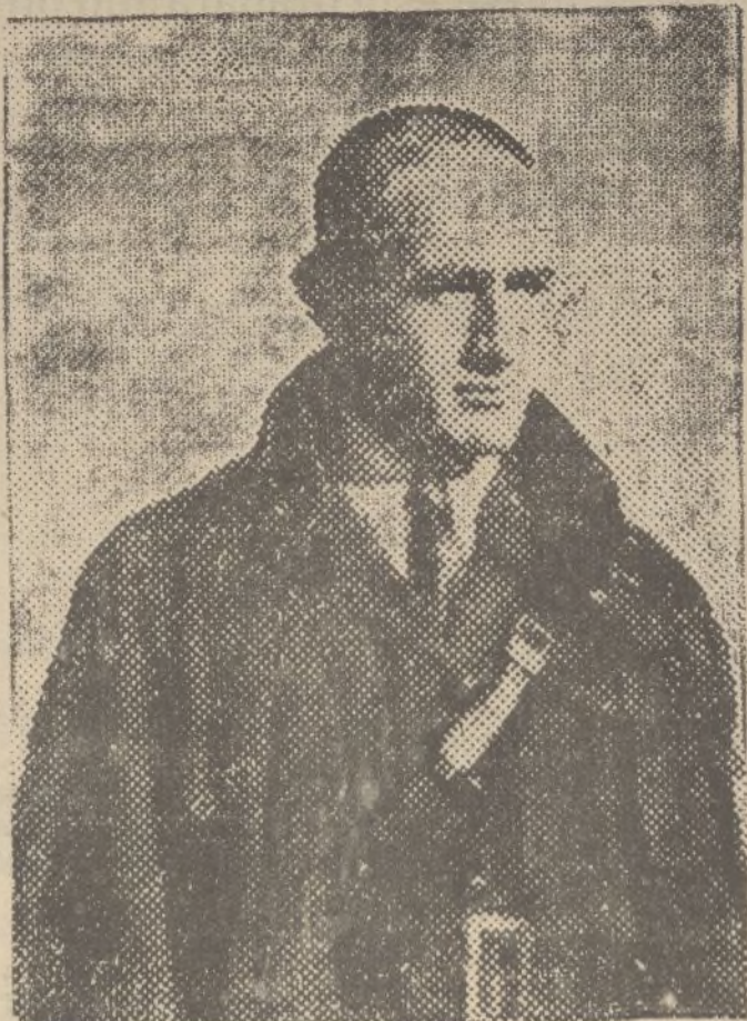
El teniente coronel don Agustin Muñoz Grande, que acaba de ser nombrado, en substitución del general Capaz, delegado de Asuntos Indígenas del Protectorado español en Marruecos

Estos dos juicios quedaron conclusos y para sentencia.