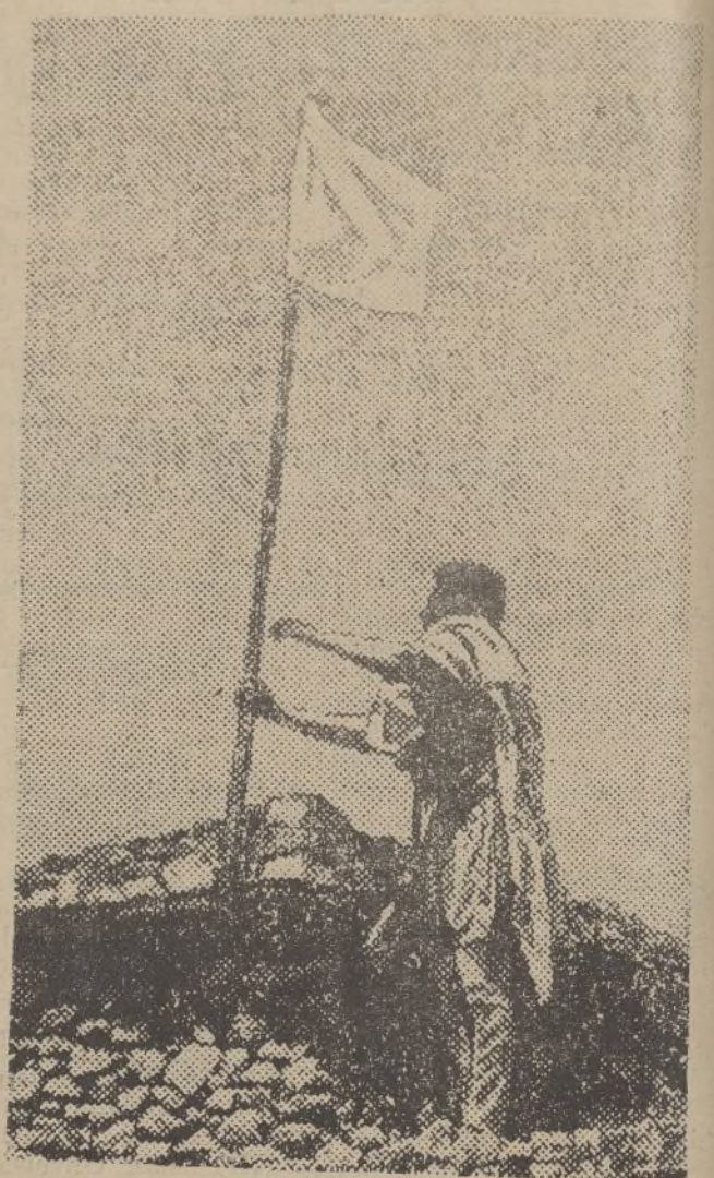
Con motivo de los avances italianos en Etiopia, son muchos los poblados que se rinden sin ofrecer resistencia.—En nuestra foto aparece un soldado etiópico, con una bandera blanca, en un pueblo situado entre Adigrat y Makale

Proyecto de decreto sobre autorización para la salida de España, en ciertas condiciones de títulos de la Deuda y otros