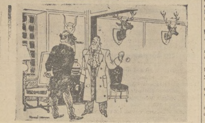
—Voy a enseñarle mi galería de retratos de antepasados. —Encantado. ¿Empieza aquí?