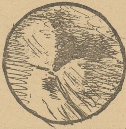
Fig. 1. a

Todo el curso de Clínica Quirúrgica 2.º año, vió salir de la desembocadura de uréter el líquido teñido de sangre, apareciendo primero como un chorro delgado, rojo, que se esparcía poco á poco en el medio transparente como se extiende en la atmósfera el humo que deja escapar de los labios contraídos un fumador.