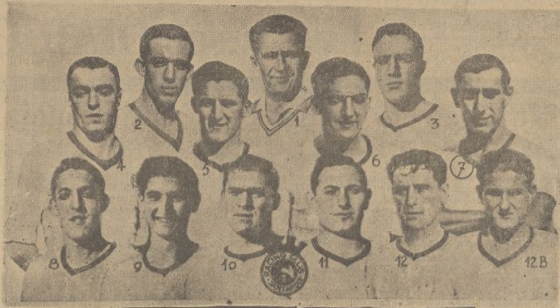
El Racing, de Santander, que en su primer partido del campeonato de Liga, ha sido vencido por un goal a cero, por el Athletic madrileño

Libros Bachillerato los encontraréis en la Papelería DIARIO DE HUELVA A. Mora Claros, 5.