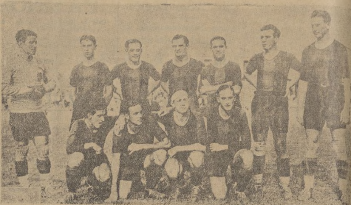
Equipo del Barcelona F. C. que en su primer partido de Liga, ha sido derrotado por su eterno rival el Deportivo Español, por un goal a cero

Recreativo G., 0-Gimnástico 0. Murcia, 7-Elche, 0 Levante, 7-Mirandilla, 2 Jerez, 2-Malacitano, 1