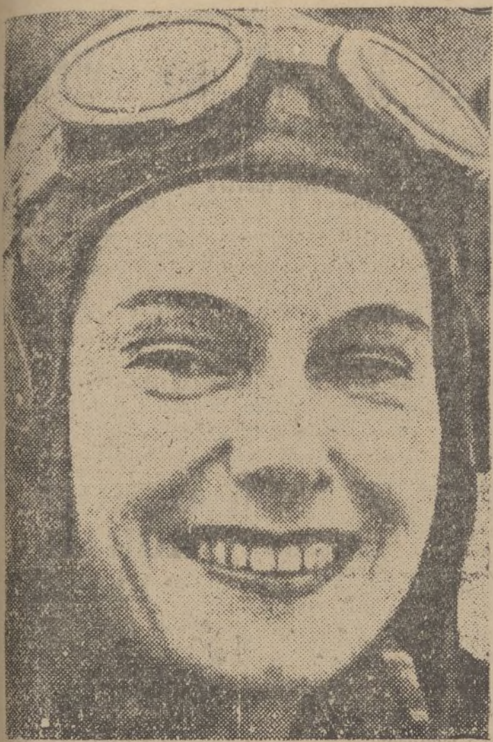
La aviadora Jean Batten, que intenta un vuelo «record» de Inglaterra a América del Sur, saliendo de Casablanca para Dakar