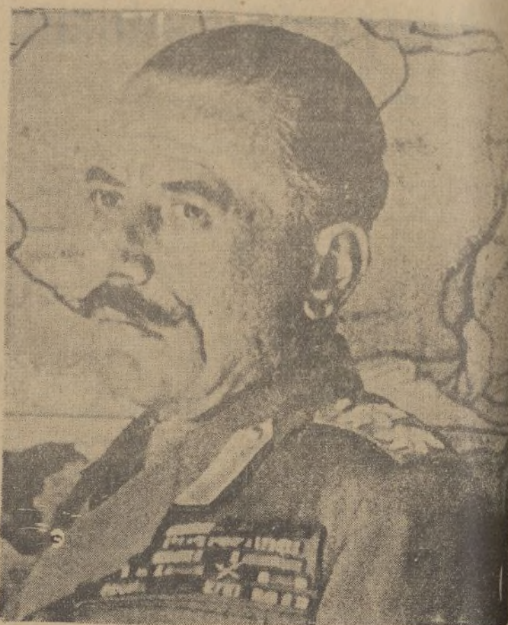
El general Condylis, que hasta el momento en que el rey Jorge se posesione del trono desempeña la regencia en Grecia