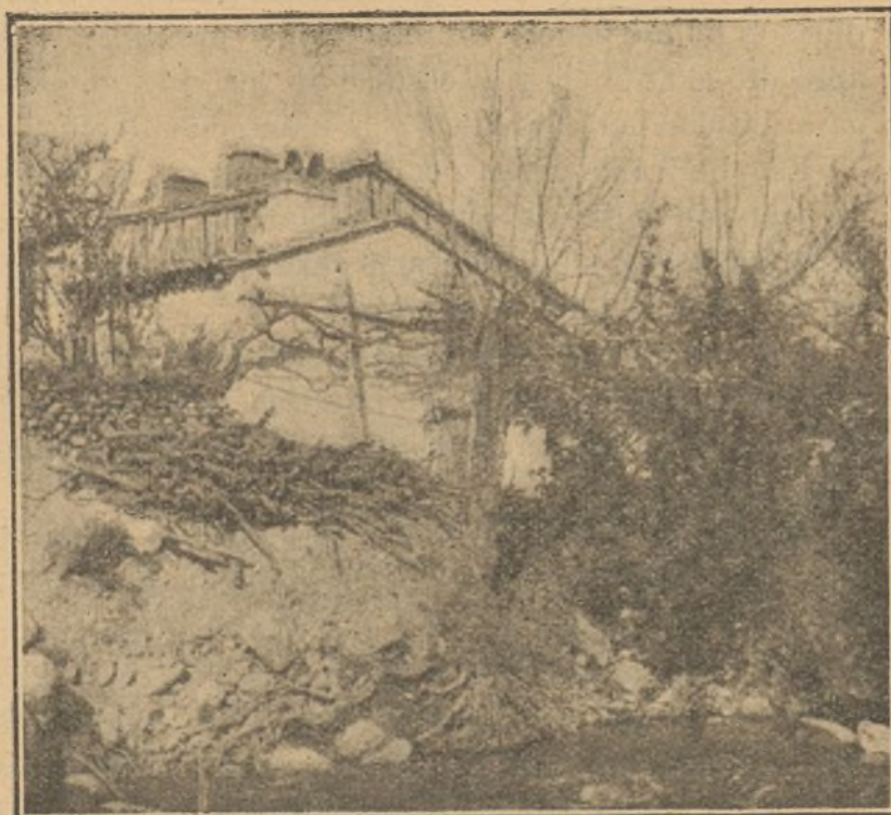
FIG. 2. a

viajes sólo parcialmente á distrito determinado, y por lo tanto, de que con una observación diaria y un análisis también diario, puede avisar del peligro, y con la prohibición del uso del agua de aquella procedencia, disminuirse considerablemente el riesgo de la epidemia.