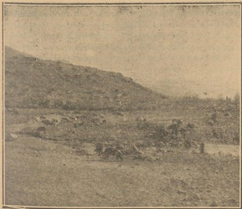
FIG. 3. a

tro á la periferia, su sistema de distribución en las casas y de conducción á ellas desde el depósito, es si no perfecto muy aceptable, dado el que se efectúa por cañerías de plomo y de hierro difícilmente permeables, á no ser en los puntos de engaste ó en aquellos en que por la antigüedad ú otras causas se encuentren deterioradas; en el depósito mismo se puede considerar relativamente garantizada, así como en su conducción desde el Pontón de la Oliva á los depósitos, en que van encauzadas dentro de tubos de fundición. Pero desde el Pontón de la Oliva á la Presa del Villar, y desde ésta al origen de la Sierra por todas sus afluentes, las condiciones no pueden ser más peligrosas. Lo mismo sucede con los puntos que tomen el agua del referido río procedente del cauce llamado Canalillo, que atraviesa una considerable extensión de terreno de los suburbios de Madrid. Estos trayectos, el del Canalillo y los kilómetros de extensión desde el Pontón de la Oliva hasta la Sierra, pasando por más de diez y ocho pueblos y por algunos muy populosos, como Buitrago, Rascafría, el Paular, Lozoya etc., son un peligro tan evidente, como á nuestro juicio fácil de evitar, y sobre él debe fijar preferentemente su atención el Gobierno.