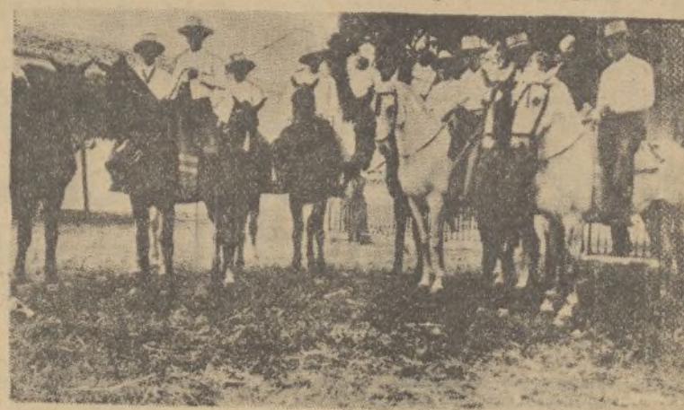
Un grupo de caballistas «choqueros»

«Ere una blanca paloma de jazmines y azucenas, dame consuelo y orfio pa que se alivien mis penas virginita del Rocío».