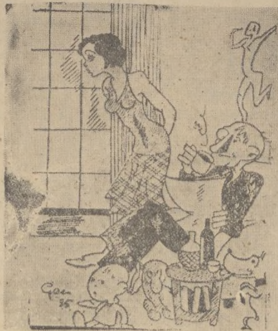
—Realmente, la "radio" del vecino es insoportable. —No es la "radio", es su mujer.