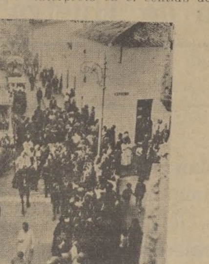
La Hermandad del Rocío desfilando por una calle de Huelva