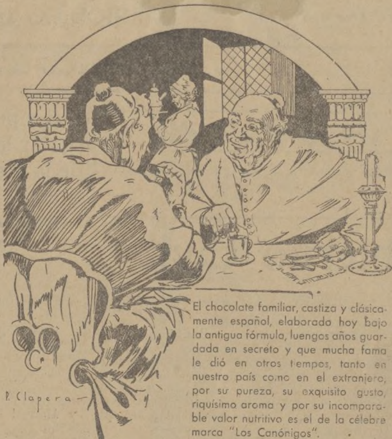
"Una jicara de chocolate 'Los Canónigos' es obra de las delicias de España".

MADRID.—La Sala de Gobierno del Tribunal Supremo, en su reunión de esta mañana, acordó, a petición del fiscal de la República, aplazar hasta el 25 del corriente la vista de la causa contra el exministro señor Largo Caballero.