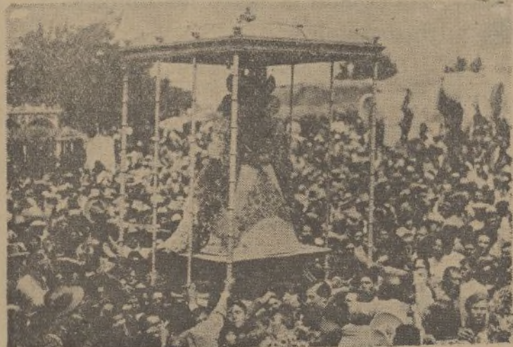
LA BLANCA PALOMA llevada procesionalmente por los romeros Almonteños.

Entre las muchas romerías que se celebran en Andalucía, la de más nombre, la más típica, la que puede contar a sus romeros por millares, la de más profunda e intensa devoción, es sin duda alguna la Romería del Rocío, La Virgen del Rocío a la que cariñosamente se le llama LA BLANCA PALOMA, vé anualmente desfilar por su Ermita de la marisma, centenares de criaturas que desde las provincias de Huelva, Sevilla, Cádiz, Córdoba etc., se reúnen el primer domingo de Pentecostés, para rezar a su Virgen, cantar a su Virgen, llorar a su Virgen y no pensar más que en su Blanca Paloma, en sus milagros, en sus gracias, y en mejorar al año