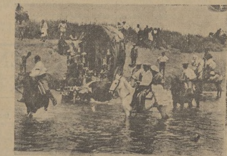
Ningún obstáculo detiene el fervor de los «Rocieros»

Pero señores es imposible, me voy al NUEVO MUNDO a tomar café y una copita y char-