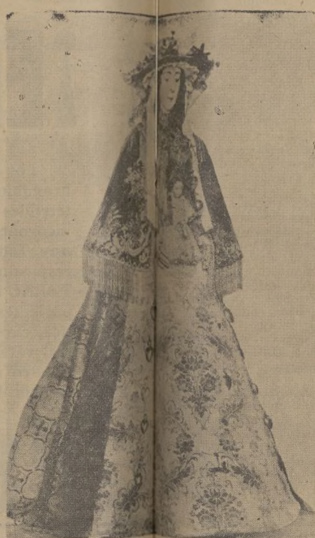
Nuestra Señora del Rocío, Patrona de Almonte