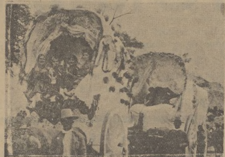
Detalle de unas carretas camino de Almonte

Pues señores yo opino y con migo creo que todos ustedes que con tanto vino, tanta bebida y tanto jaleo las «turcas» van a ser también abundantes en el Rocío y hay algunos «malagres», qué se ponen más «pe