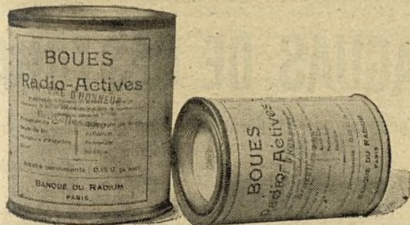
ACTIVIDAD PERMANENTE 0,15 U

La medicación es cómoda y rápida en sus efectos, evitando su oportuna aplicación los inconvenientes que representan para los pacientes las curas termales y los tratamientos farmacológicos prolongados.