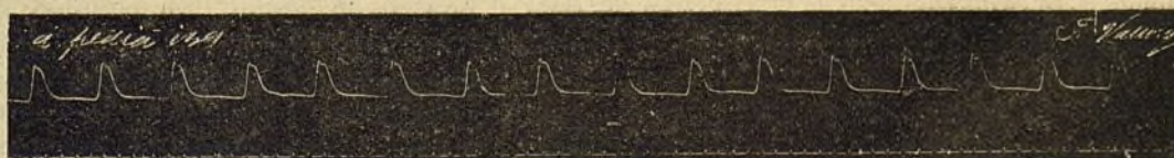
Fig. 2. a