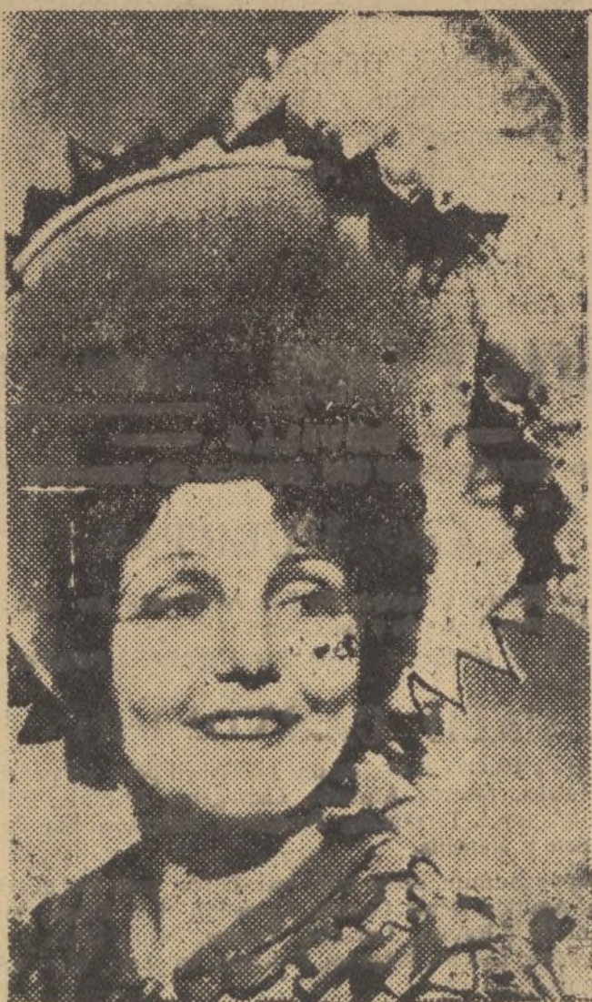
Conchita Supervia, la famosa cantante española que ha muerto en una clínica de Londres, donde estaba hospitalizada para dar a luz