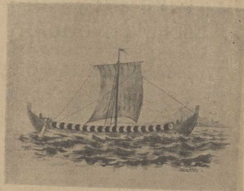
Tipo de barcos empleados por los vikingos

Pero la emigración va más lejos. Una vez Islandia descubierta, los navegantes noruegos debían casi fatalmente encontrar de este modo Groenlandia y así sucedió. En el décimo siglo una nueva emigración tiene lugar, venida en parte de Islandia, en parte de Noruega hacia las regiones meridionales del Oeste de