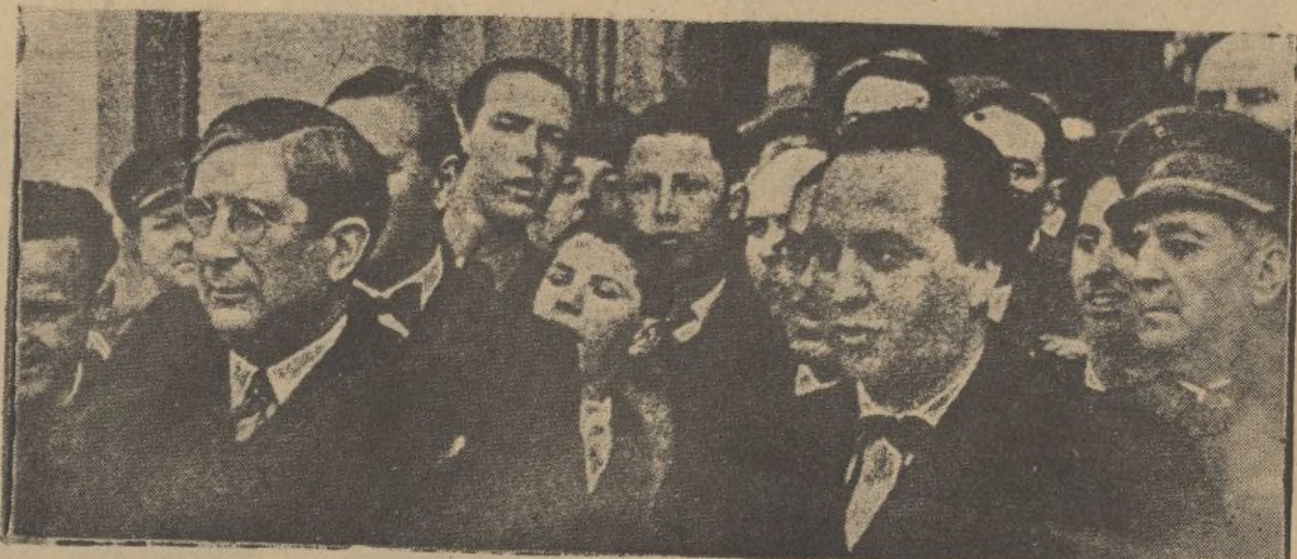
El ministro de Instrucción Pública, don Marcelino Domingo, a su llegada a Barcelona, recibido por el consejero de Cultura de la Generalidad, señor Gassol, y por las autoridades de la capital catalana.