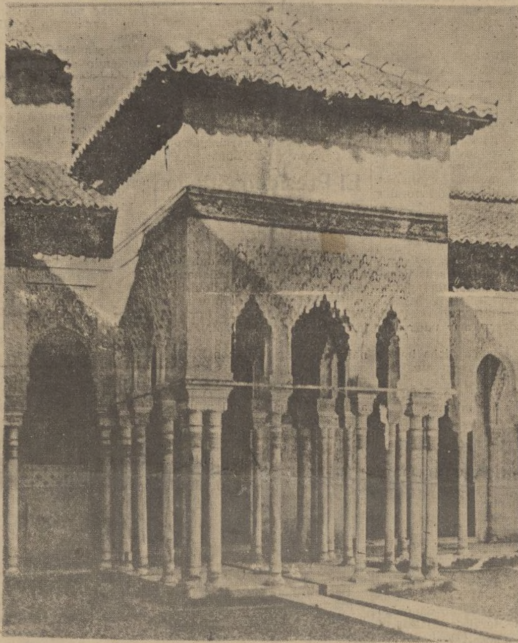
Templete del extremo Oeste del Patio de los Leones