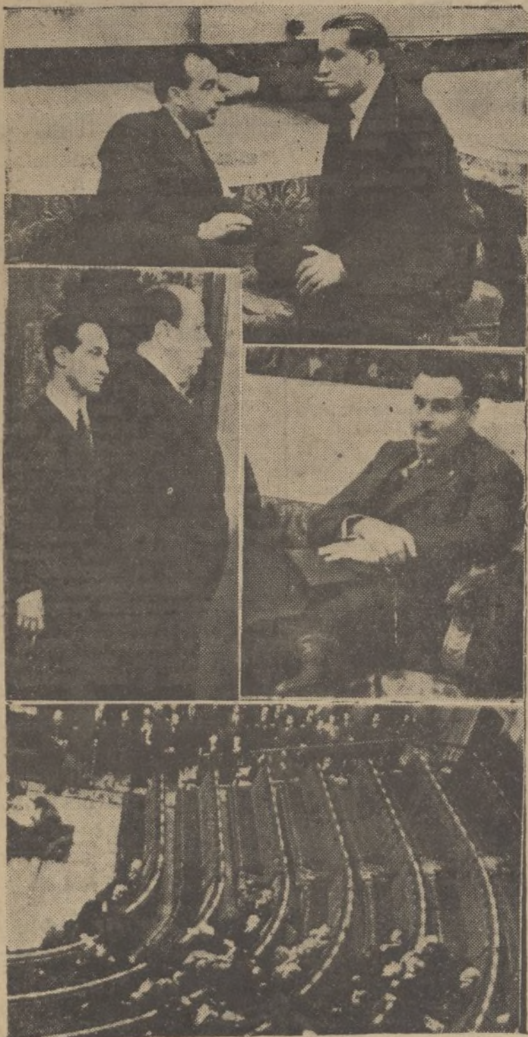
De izquierda a derecha y de arriba abajo: Los señores Villalonga y Calvo Sotelo conferencian después de haberse retirado las derechas del salón de sesiones.—El Sr. Gil Robles en los pasillos de la Cámara.—El señor Giménez Fernández poco antes de su intervención.—Aspecto del salón de sesiones de la Cámara después de la retirada de las derechas.