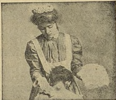
En Furúnculos, Tumores, etc.