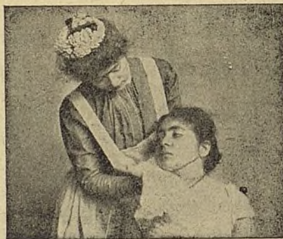
En Anginas, Laringitis, etc.

Instrucciones generales: Calientese siempre en el mismo bote (nunca en un paño), en agua caliente. Cuidese de que no penetre agua en el medicamento. Cuando esté tan caliente como pueda resistirse sin molestia, tómese un cuchillo ó espátula apropiado y aplíquese tan rápidamente como sea posible, extendiéndose la Antiphlogistine sobre la piel de la parte afectada, por lo menos con un espesor de un octavo de pulgada y cúbrase inmediatamente con algodón en abundancia y un vendaje ó compresa á propósito. La menor exposición al aire ó el contacto con el agua reduce extraordinariamente la fuerza curativa de la Antiphlogistine ; así, pues, háganse todas las aplicaciones con suma rapidez. Renuévense los apósitos tan pronto se desprendan con facilidad, usualmente después de 12 á 24 horas de aplicados.