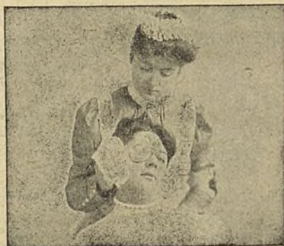
En Inflamaciones de los ojos.