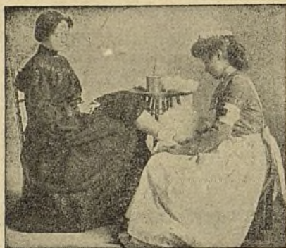
En Úlceras crónicas.

COMPOSICIÓN: La Antiphlogistine está compuesta de un silicato de aluminio, de glicerina químicamente pura, y de una pequeña proporción de sustancias antisépticas (ácido bórico y salicílico) con indicios de yodo y aceites esenciales.