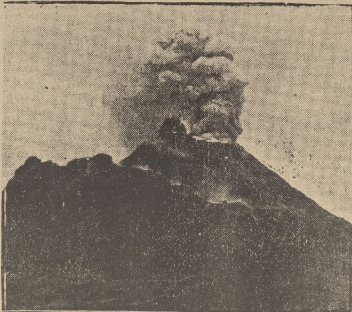
El Vesubio nuevamente en actividad. Todos los años, en esta época de primavera, se anuncia la columna de humo, recuerdo persistente de antiguas destrucciones. Este año, el Vesubio ha aumentado la importancia de su propio fuego. En el cráter central se ha producido un hundimiento, que puede originar una disgregación del cono, facilitando la salida de la lava. Este ha avanzado ya en una extensión de 300 metros en dirección Oeste.

En vista del éxito conseguido en Nerva, los pequeños artistas fueron contratados para actuar el lunes en Río-Tinto, donde también alcanzaron un gran triunfo.