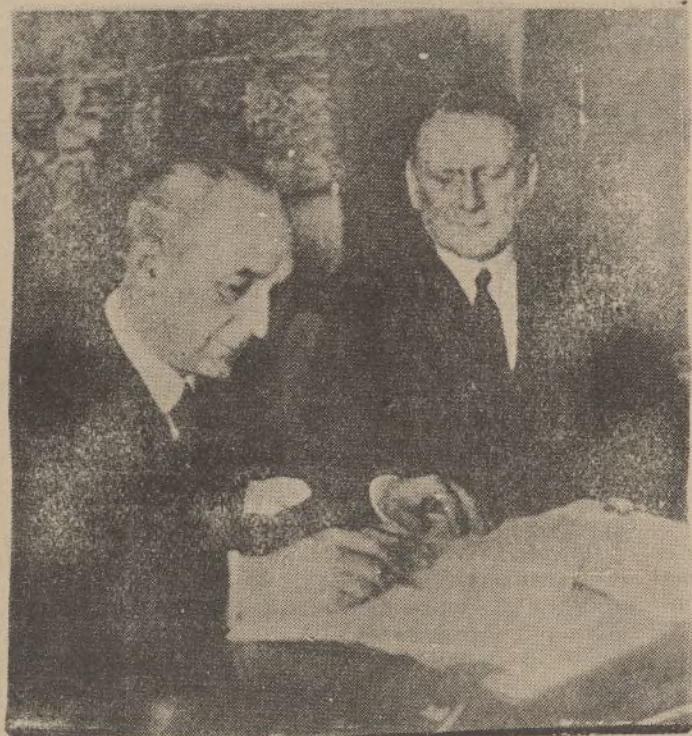
El ministro de Estado, señor Barcia, y el embajador belga M. Everts, en el acto de la firma del Tratado comercial entre España y Belgica. El convenio resuelve satisfactoriamente las aspiraciones de ambos países.